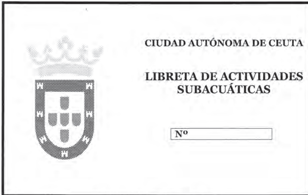
CUBIERTA (parte anterior)