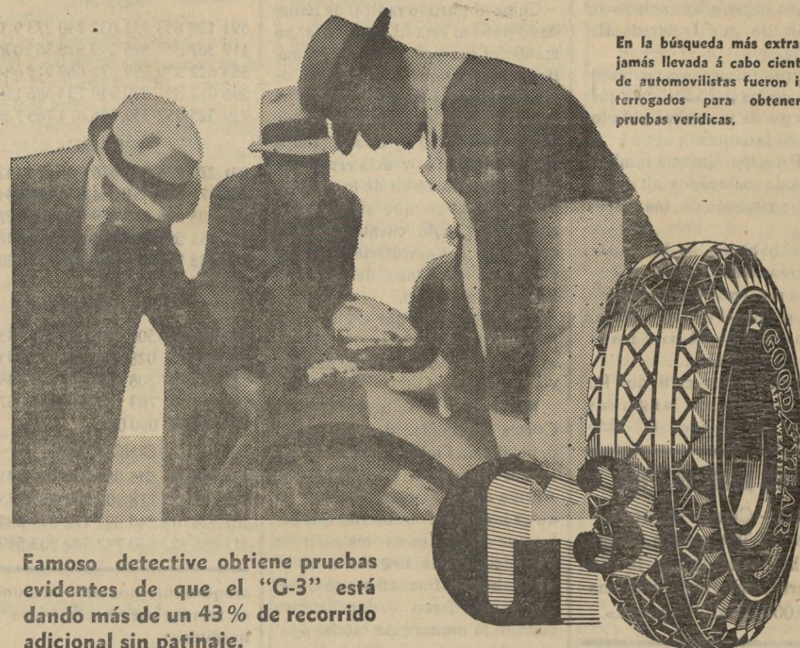
En la búsqueda más extraña jamás llevada a cabo cientos de automovilistas fueron interrogados para obtenerse pruebas verídicas.

Famoso detective obtiene pruebas evidentes de que el «G-3» está dando más de un 43% de recorrido adicional sin patinaje.