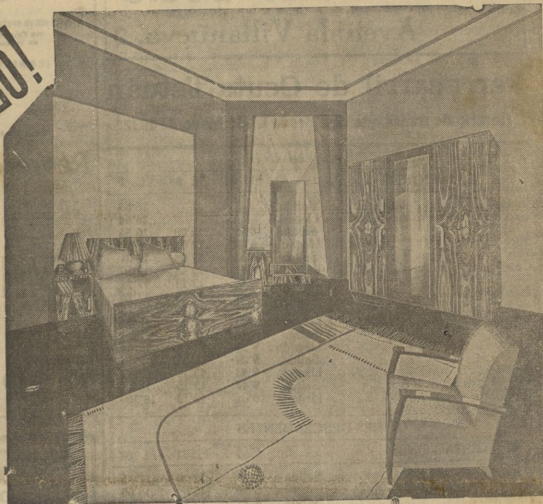
N.º 512 — Dormitorio Nogal varnizado al tampon, forma moderna, compuesto de: un armario guarda ropa con luna, 3 puertas, ancho: 1 m. 50; alto: 1 m. 90, luna biselada, interior a 2 lados, en el medio colgador de trajes; 1 cama de centro ancho: 1 m. 50; 1 mesa de noche biblioteca cubierta marmol.

..... y apesar de su precio un conjunto de buen gusto de una fabricacion perfecta y garantizada por una antigua Casa de confianza.