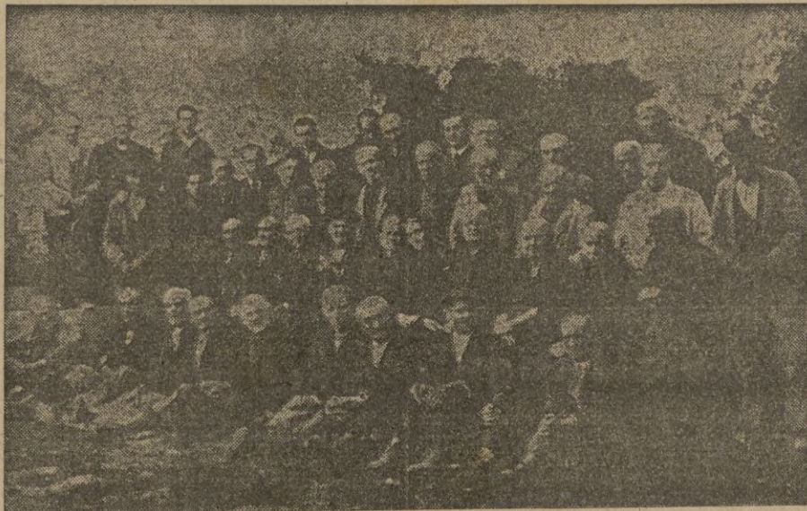
Grupo de ancianos y ancianas que ayer recibieron sus carnets de Subsidio de Vejez, acompañados del Delegado Provincial del Instituto y demás personal.

¡Esta es la nueva España!, decían y exaltaban la obra social del nuevo Estado, que tan en cuenta tiene las necesidades de los pobres, que, al llegar a sus últimos años no tienen más