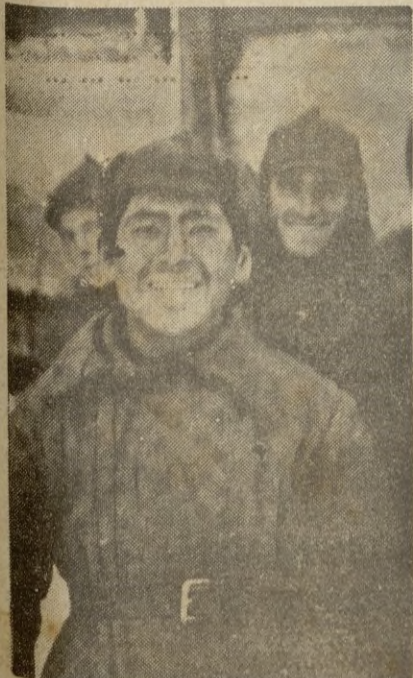
Algunos prisioneros rusos, aceptan su suerte con la sonrisa en los labios