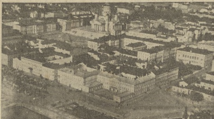
Vista parcial de Helsinki. Al centro la Catedral

Y una de las mejores urbanizadas del mundo