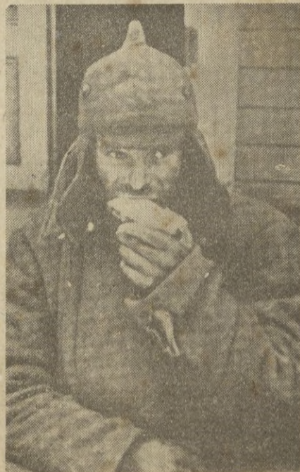
Otro prisionero ruso, saborea con glotonería su desayuno.

Hay que esperar que no ocurra nada; pero si ocurriera Turquía sabrá adoptar todas las medidas necesarias para su defensa. — STEFANI.