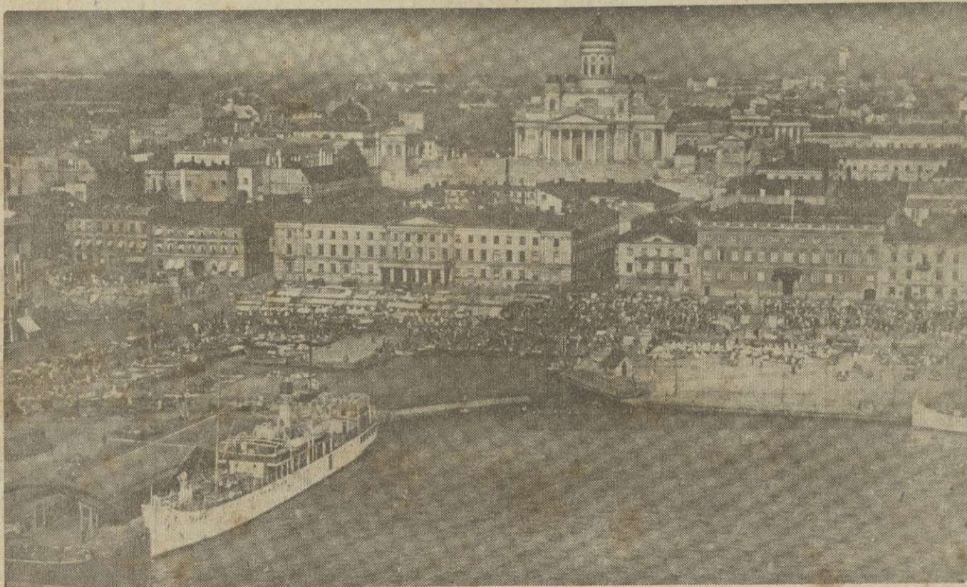
EL PUERTO SUR DE HELSINKI

Moscú, 1. — Comunicado del Estado Mayor de la Circunscripción militar de Leningrado: