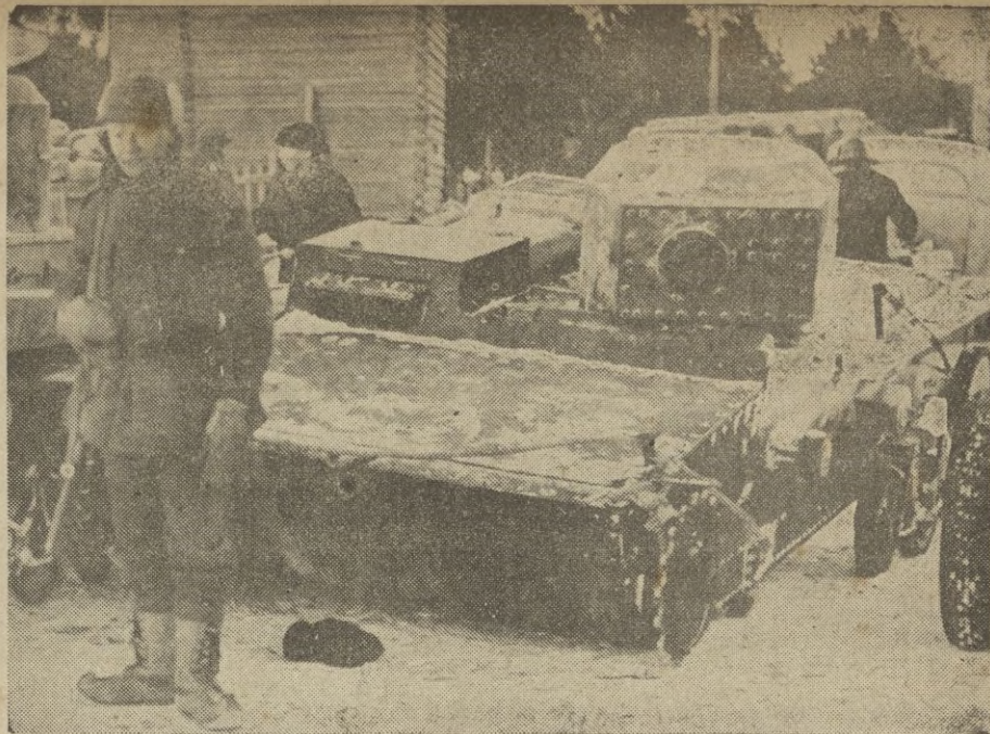
Carro de asalto ruso capturado y deteriorado