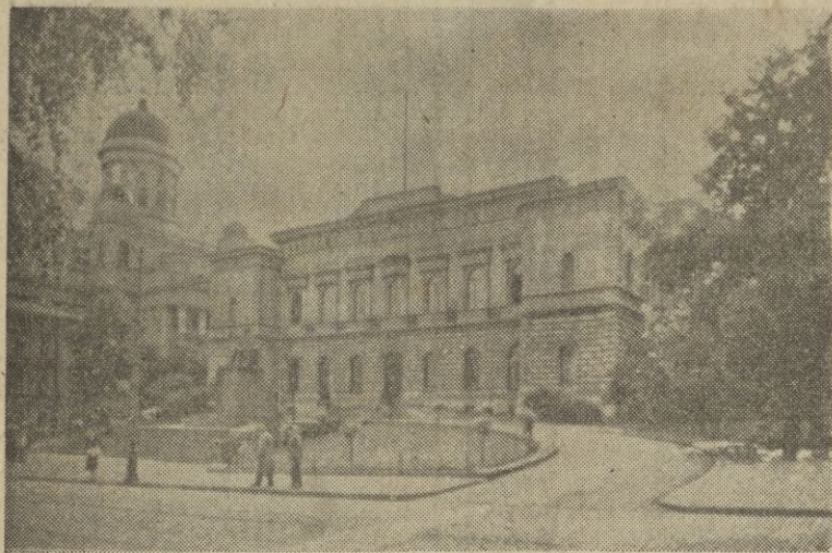
Banco Nacional de Finlandia en Helsinki.