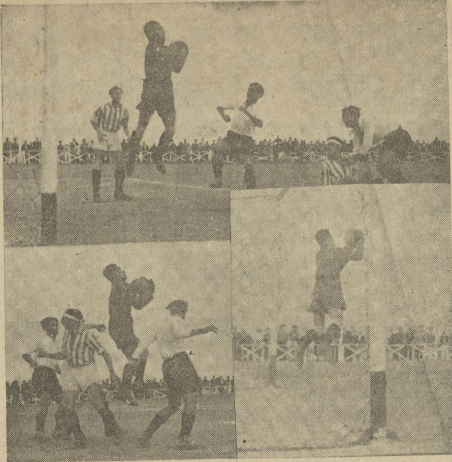
Tres momentos de peligro para la meta bética, que demuestran cómo acosaron y defendieron de su puerta los merengues.