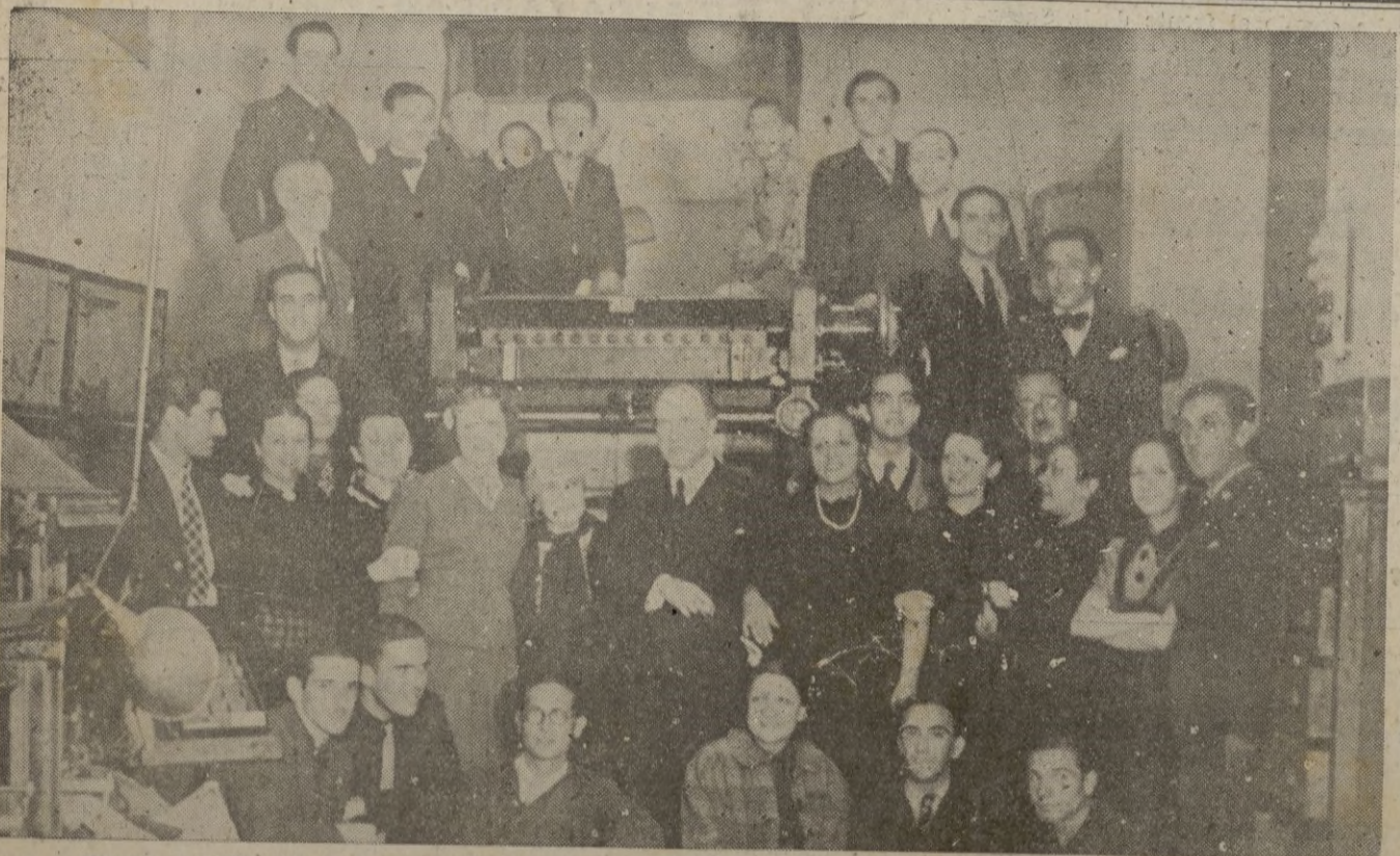
Nuestros visitantes y el personal de EL FARO en simpática hermandad conviven un largo rato

Los gastos hechos hasta ahora se calculan en cerca de catorce millones de libras y en breve se harán otros por valor de trece millones, cuatrocientas mil libras. — EFE.