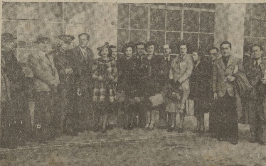
Autoridades locales, el Catedrático señor Santa Olalla y alumnos que le acompañan, a su llegada a Ceuta el pasado domingo.

La Cámara aprobó la proposición del Gobierno. — EFE.