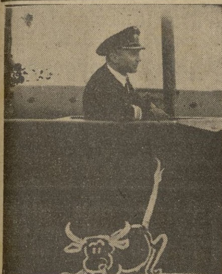
El Comandante del submarino, Prien, que hundió más de 200.000 toneladas de buques enemigos, fué recibido por el Führer de Alemania quien premió sus heroicas hazañas imponiéndole personalmente la Gran Laureada de la Cruz de Caballero.