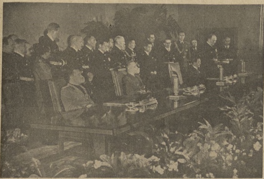
Los plenipotenciarios de los tres países, Conde Ciano, von Ribbentrop y el Embajador del Japón en Berlín Kuru su, durante la lectura de los textos del documento trascendental.