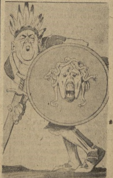
El Marte americano: "Todos darán petrificados ante estos enemigos de América que eseno".