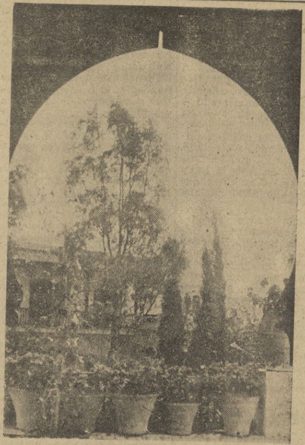
Tetuán está preparando ya su segunda exposición de flores. Al éxito rotundo del pasado año sobrepasará el de éste, ya que la experiencia servirá para marcar mejor la puesta en marcha de este torneo artístico de nuestra flora. ¡Exaltemos el motivo y preparémonos a ver cuanto de notable se presente en esta segunda exposición!