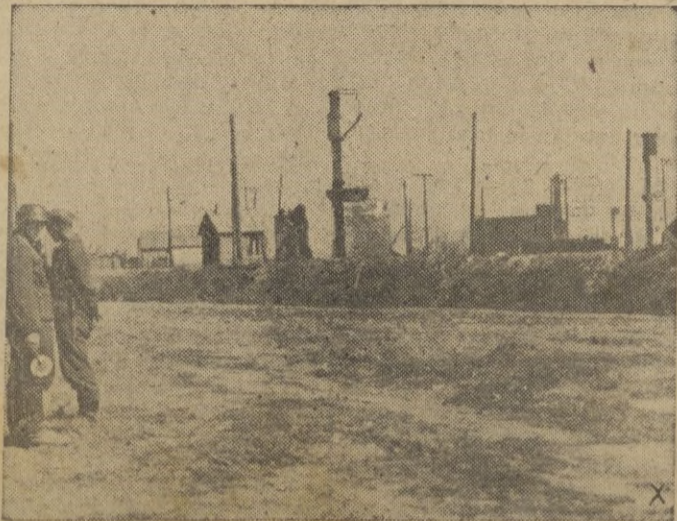
Un puesto de policía del tráfico en Stalingrado.

Después de saludar a todos, S. E. marchó a la Residencia.