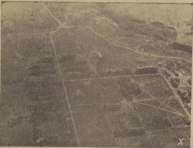
Vista aérea de un enorme complejo de cuarteles soviéticos al Oeste de Stalingrado, que quedaron destruidos completamente.

En Marsa Matruk los aviones alemanes han destruido tanques y columnas de camiones británicos.