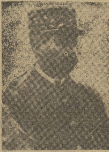
El general Giraud

"En relación con las nuevas operaciones militares en el Norte de Africa, Su Excelencia el Jefe del Estado y el ministro de Relaciones Exteriores han recibido del Presidente de los Estados Unidos y del Gobierno de Su Majestad Británica garantía escrita de que serán respetados plenamente los territorios espa-