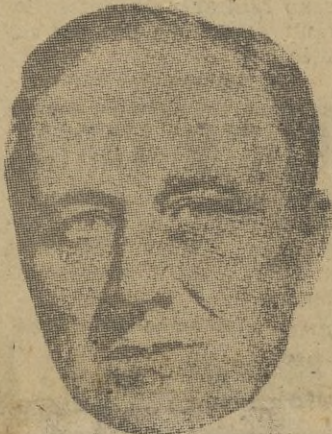
El presidente Roosevelt

Londres, 9. 17. — De Gaulle ha dirigido por radio un mensaje a los franceses del Africa del Norte invitándoles a unirse a las tropas aliadas.