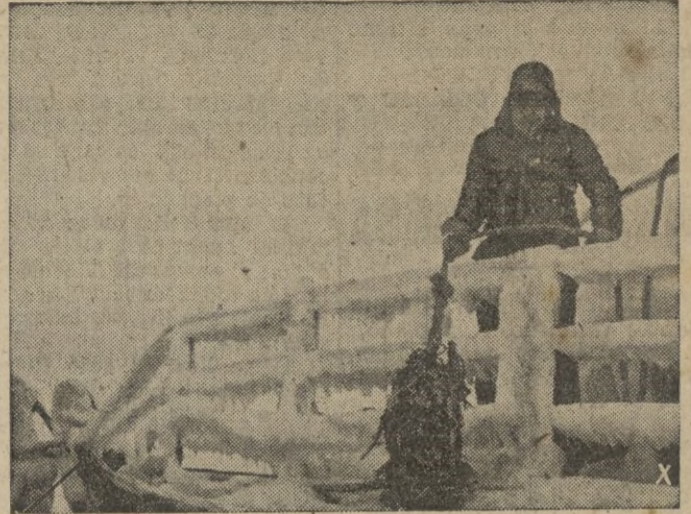
Un buque buscaminas alemán regresa de un largo raid por aguas septentrionales.