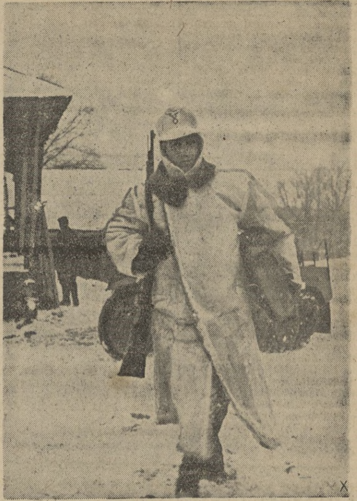
Después de dejar la motocicleta de cadenas, el correo se dirige con su cartera al punto de mandos para cumplir su misión.