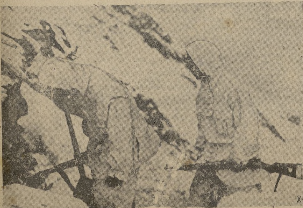
Los cazadores alemanes de Montaña en el Cáucaso vuelven a sus abrigados refugios después de rechazar el ataque ruso.