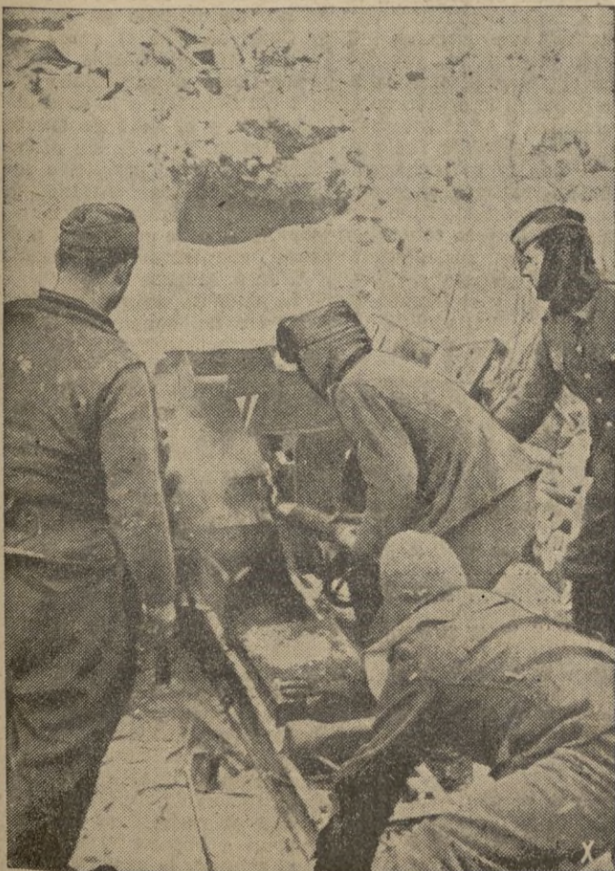
Artillería ligera alemana en los combates defensivos del sector de Veliki-Luki