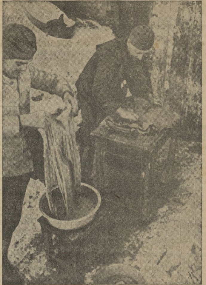
Día de lavado en una chavola del frente ruso