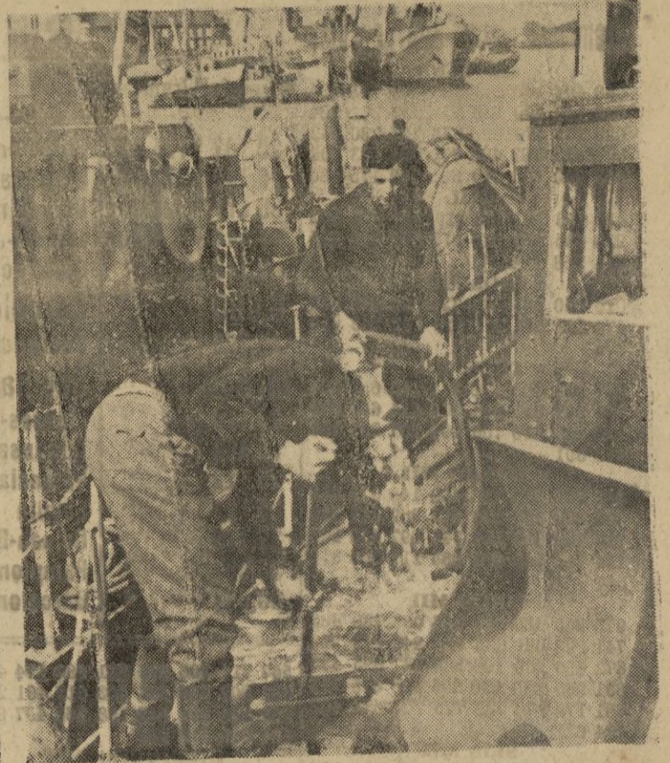
Después del largo crucero, el buque rastreador, limpia conscientemente la cubierta por espantosa para nu vass em- pre s's.