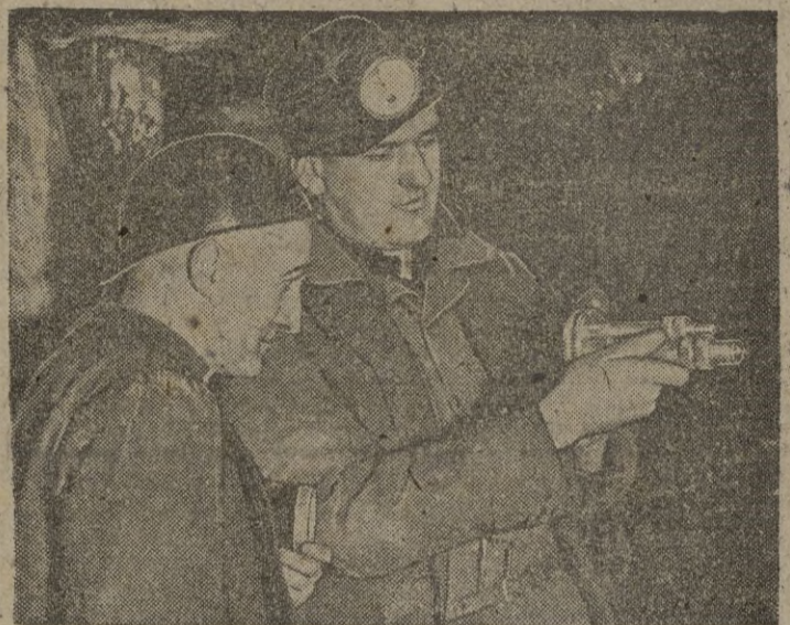
Inglaterra trata de intensificar la producción de sus minas y para ello utiliza los más modernos materiales. He aquí a un inspector presenciando las pruebas de un nuevo aparato.