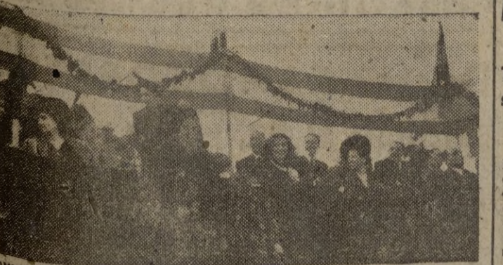
OVIEDO. — La esposa del Jefe del Estado, acompañada de su hija y demás personalidades, preside la corrida de toros celebrada en esta ciudad.