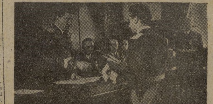
CUATRO VIENTOS.—Un momento del solemne acto de la entrega por el ministro del Aire de los títulos a los nuevos capitanes ingenieros aeronáuticos de la 13.ª promoción. En la foto el ministro saluda a don Juan de la Cierva, hijo del ilustre y malogrado inventor del autogiro, después de entregarle el título

Entrega de títulos a nuevos capitanes ingenieros aeronáuticos