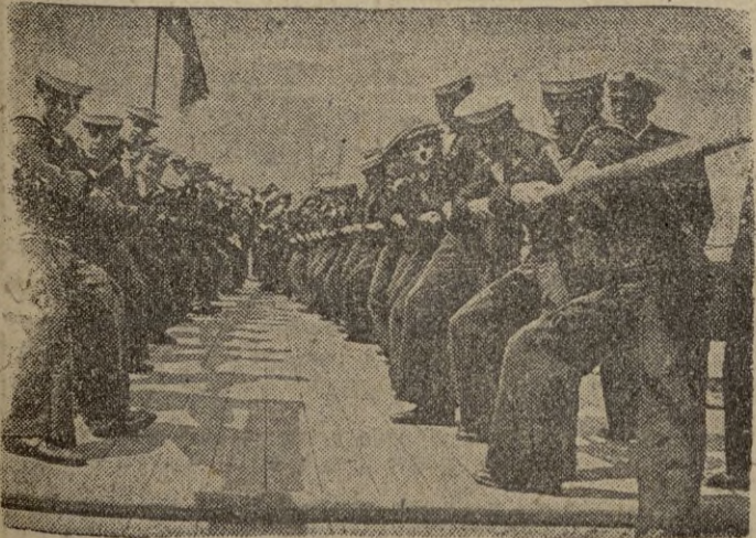
Veinte mil cadetes navales han llegado a los centros de entrenamiento náutico y a bordo de los navíos surtos en Portsmouth. He aquí un grupo de cadetes empeñados en un tug-of-war. (Calpe)

Próximamente llegará a esta plaza una gran partida de máquinas para coser y bordar ALFA en los últimos modelos. a parte mecánica perfecta, como siempre, pero los muebles vienen cada día mejor terminados y más bonitos.