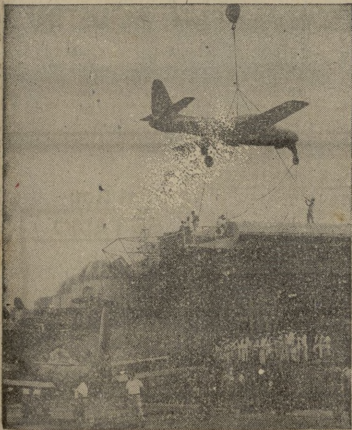
Siete aviones de propulsión a chorro, primer lote de cuarenta, han sido embarcados en un puerto norteamericano con destino a Noruega, Dinamarca, Francia, Bélgica y los Países Bajos. Un momento de las operaciones de carga.