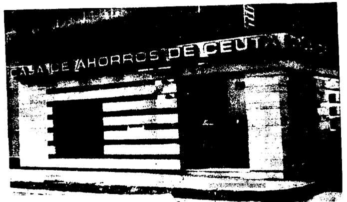
URBANA NUM. DOS Barriada de San José (CAJERO AUTOMÁTICO)