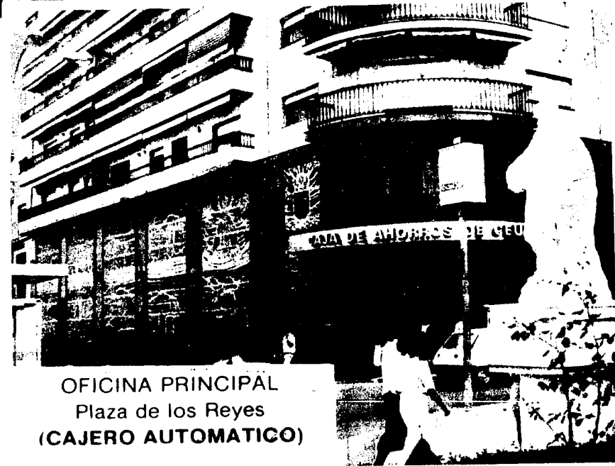
OFICINA PRINCIPAL Plaza de los Reyes (CAJERO AUTOMÁTICO)