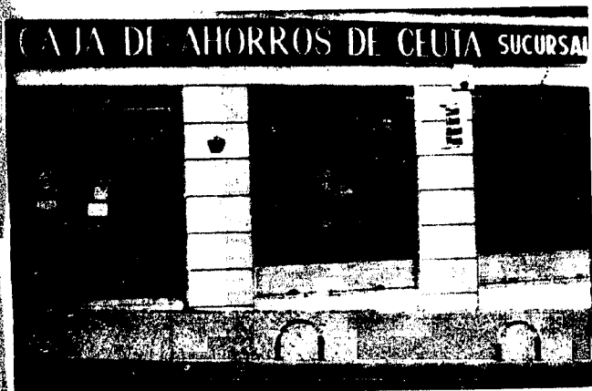
URBANA NUM TRES Barriada de Villa-Jovita