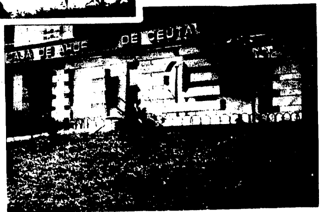
URBANA NUM CUATRO Polígono Virgen de África