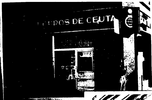
URBANA NUM UNO Plaza de la Constitución (CAJERO AUTOMÁTICO)