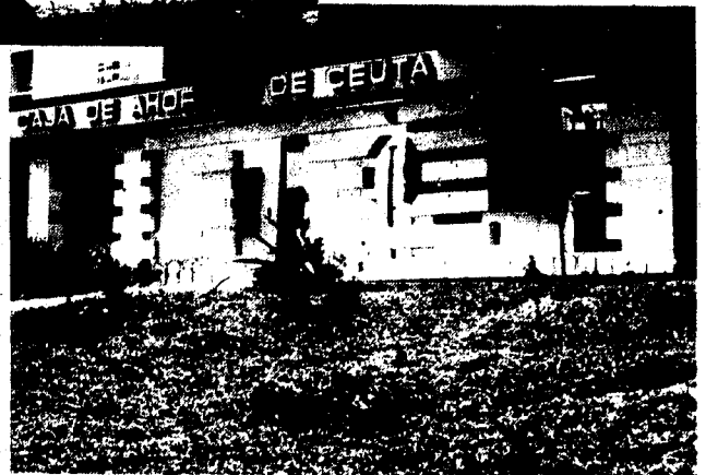
URBANA NUM. CUATRO Polígono Virgen de Afric