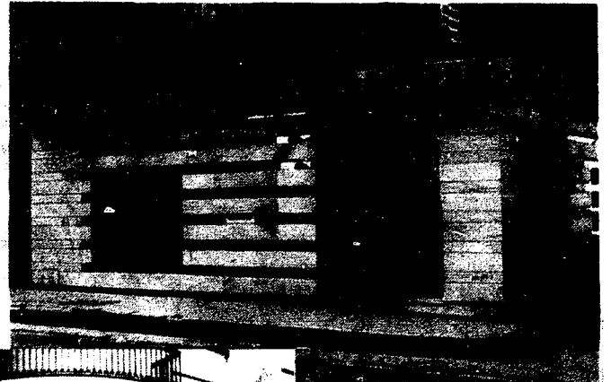
URBANA NUM. DOS Barriada de San José (CAJERO AUTOMATICO)