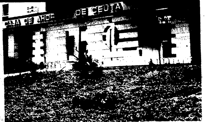
URBANA NUM. CUATRO Polígono Virgen de Africa