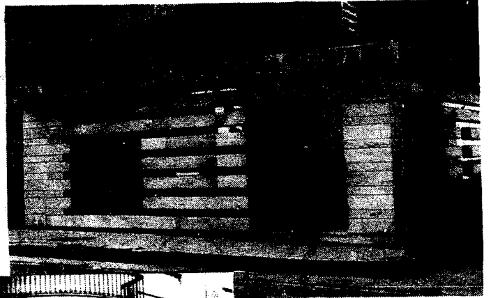
URBANA NUM. DOS Barriada de San José (CAJERO AUTOMÁTICO)