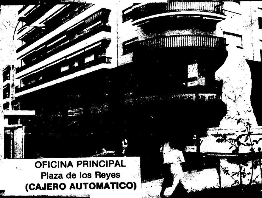
OFICINA PRINCIPAL Plaza de los Reyes (CAJERO AUTOMÁTICO)