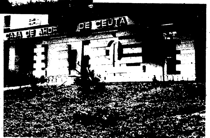
URBANA NUM. CUATRO Polígono Virgen de Africa