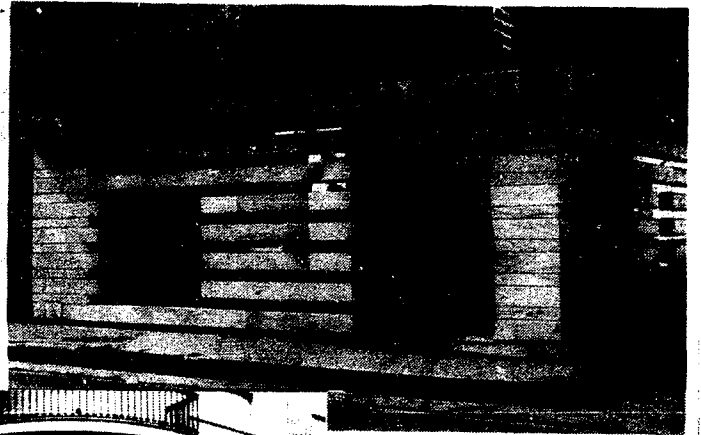
URBANA NUM. DOS Barriada de San José (CAJERO AUTOMATICO)