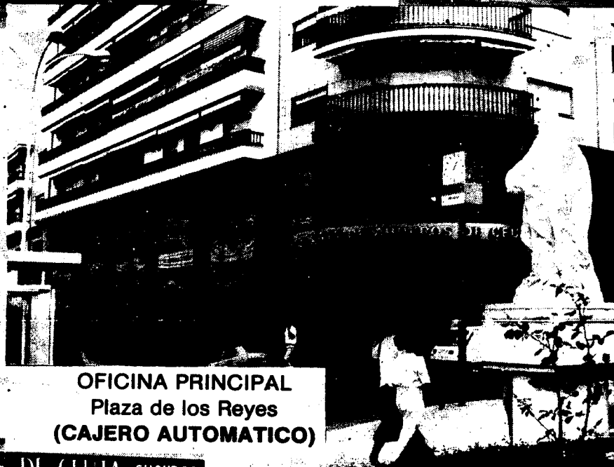
OFICINA PRINCIPAL Plaza de los Reyes (CAJERO AUTOMATICO)