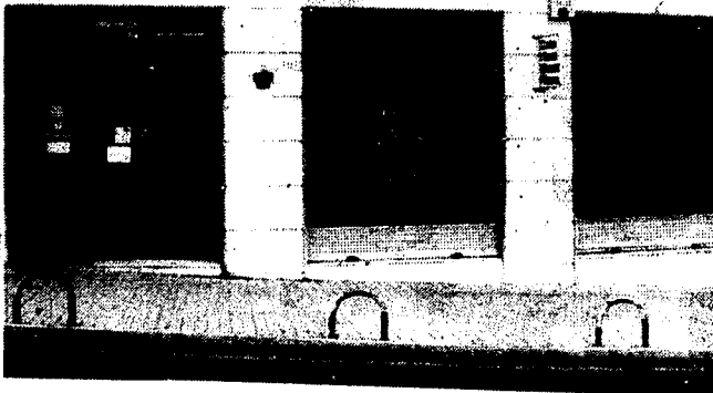
URBANA NUM. TRES Barriada de Villa-Jovita