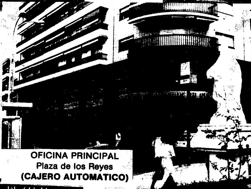
OFICINA PRINCIPAL Plaza de los Reyes (CAJERO AUTOMATICO)