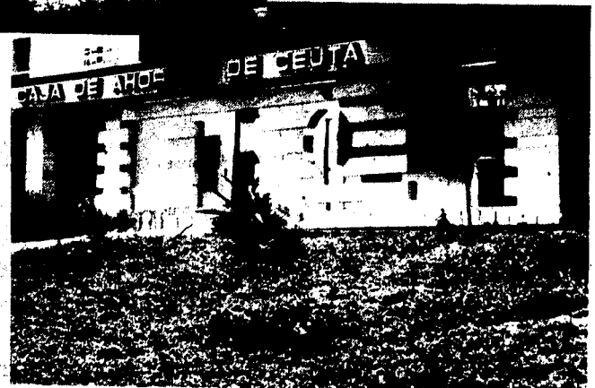
URBANA NUM. CUATRO Polígono Virgen de Africa