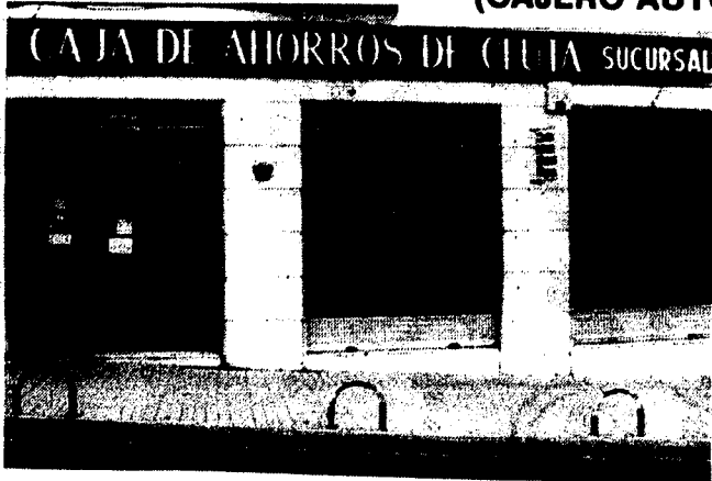
URBANA NUM. TRES Barriada de Villa-Jovita