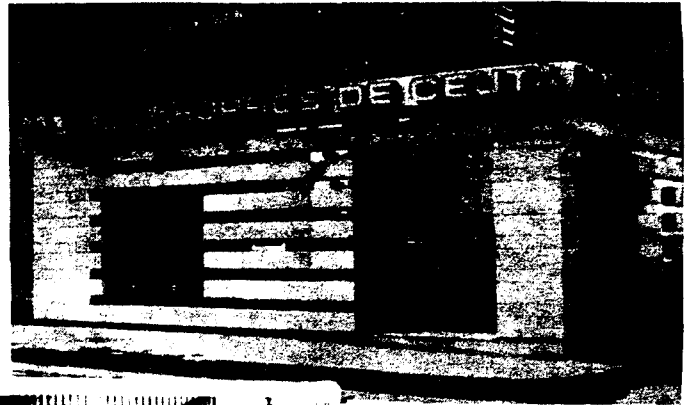
URBANA NUM. DOS Barriada de San José (CAJERO AUTOMATICO)