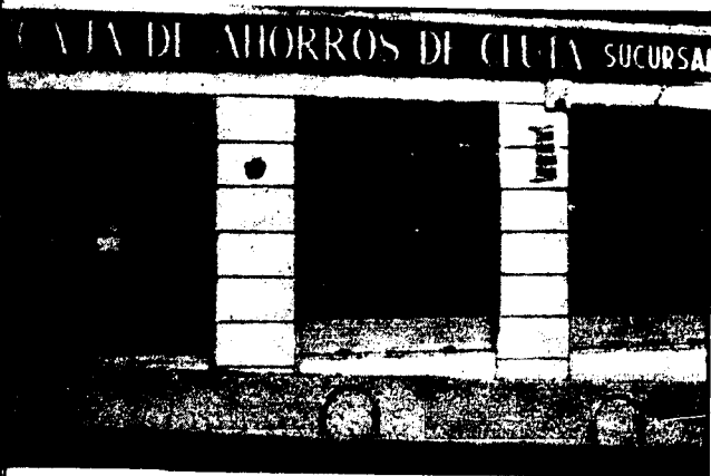
URBANA NUM TRES Barriada de Villa-Jovita