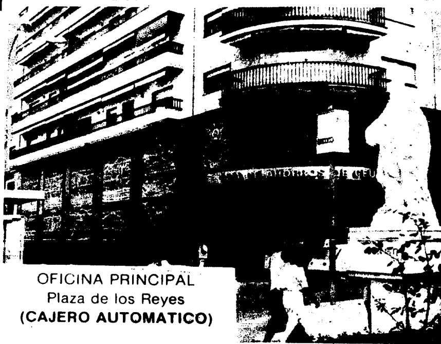
OFICINA PRINCIPAL Plaza de los Reyes (CAJERO AUTOMATICO)