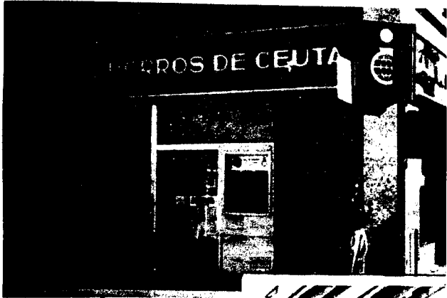
URBANA NUM UNO Plaza de la Constitución (CAJERO AUTOMATICO)