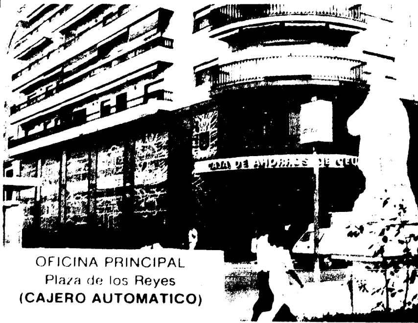
OFICINA PRINCIPAL Plaza de los Reyes (CAJERO AUTOMÁTICO)