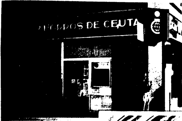
URBANA NUM. UNO Plaza de la Constitución (CAJERO AUTOMÁTICO)