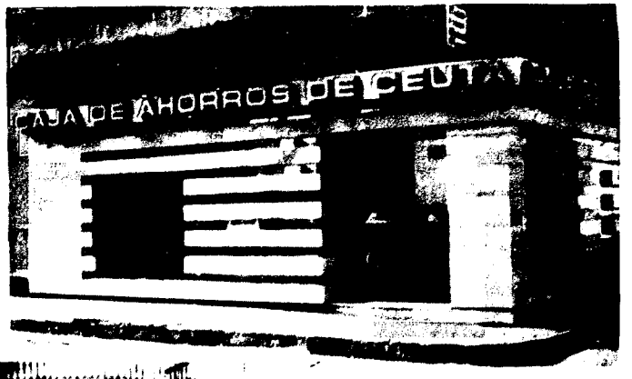
URBANA NUM. DOS Barriada de San José (CAJERO AUTOMÁTICO)