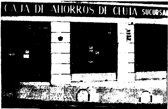
URBANA NUM. TRES Barriada de Villa-Jovita