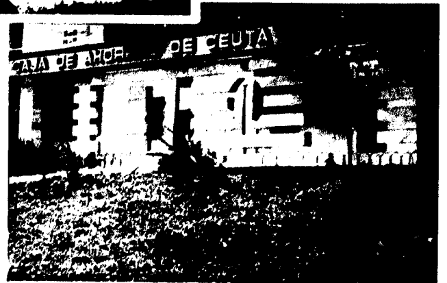
URBANA NUM. CUATRO Polígono Virgen de África