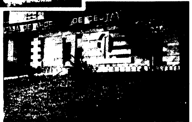
URBANA NUM. CUATRO Polígono Virgen de África