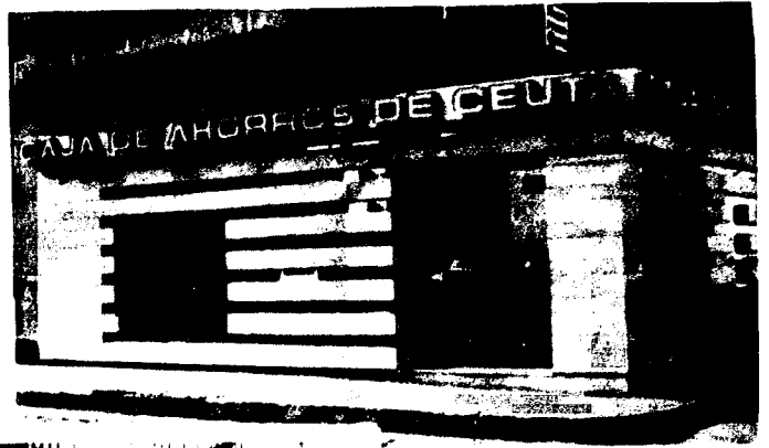
URBANA NUM. DOS Barriada de San José (CAJERO AUTOMÁTICO)