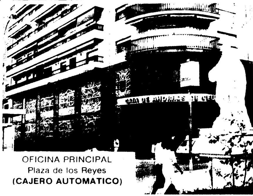
OFICINA PRINCIPAL Plaza de los Reyes (CAJERO AUTOMÁTICO)