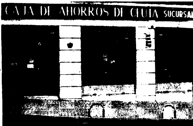
URBANA NUM. TRES Barriada de Villa-Jovita