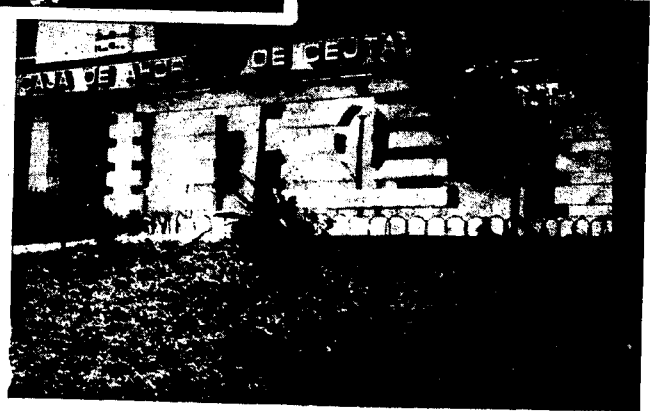
URBANA NUM CUATRO Poligono Virgen de Africa