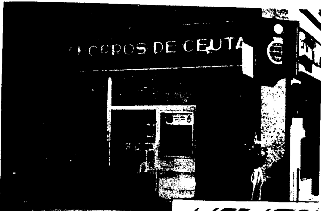
URBANA NUM UNO Plaza de la Constitución (CAJERO AUTOMATICO)