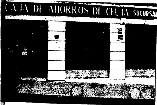
URBANA NUM TRES Barriada de Villa-Jovita