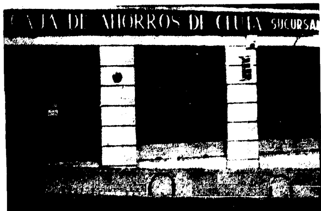
URBANA NUM. TRES Barriada de Villa-Jovita