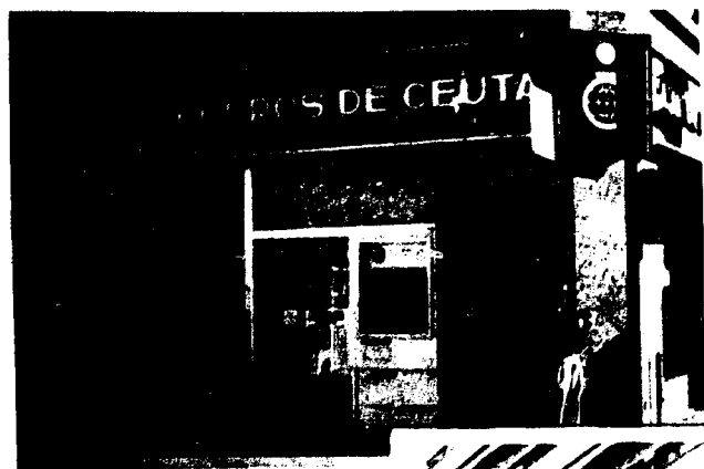
URBANA NUM. UNO Plaza de la Constitución (CAJERO AUTOMATICO)