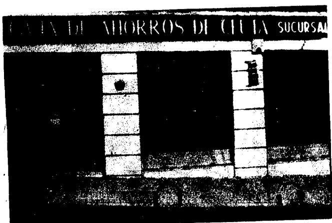
URBANA NUM TRES Barriada de Villa-Jovita