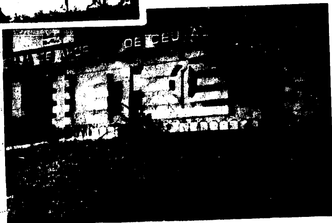
URBANA NUM CUATRO Poligono Virgen de Africa