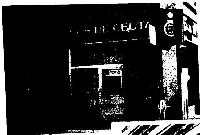
URBANA NUM UNO Plaza de la Constitucion (CAJERO AUTOMATICO)