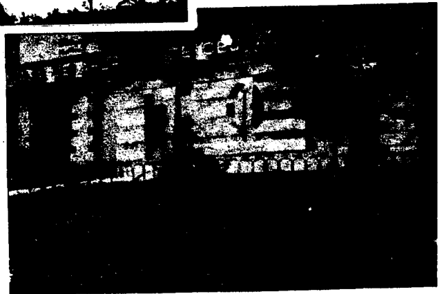
URBANA NUM CUATRO Poligono Virgen de Africa