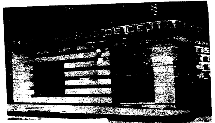
URBANA NUM. DOS Barriada de San José (CAJERO AUTOMATICO)