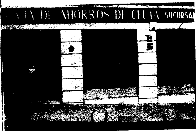
URBANA NUM TRES Barriada de Villa-Jovita