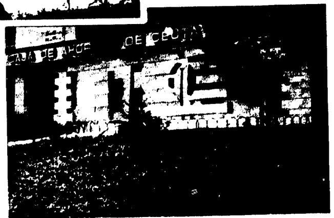
URBANA NUM CUATRO Poligono Virgen de Africa