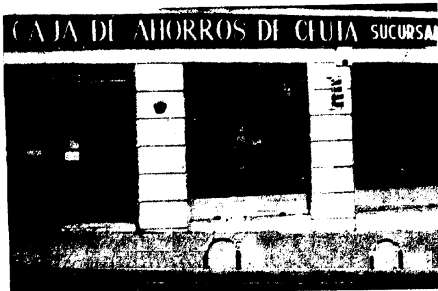
URBANA NUM TRES Barriada de Villa-Jovita