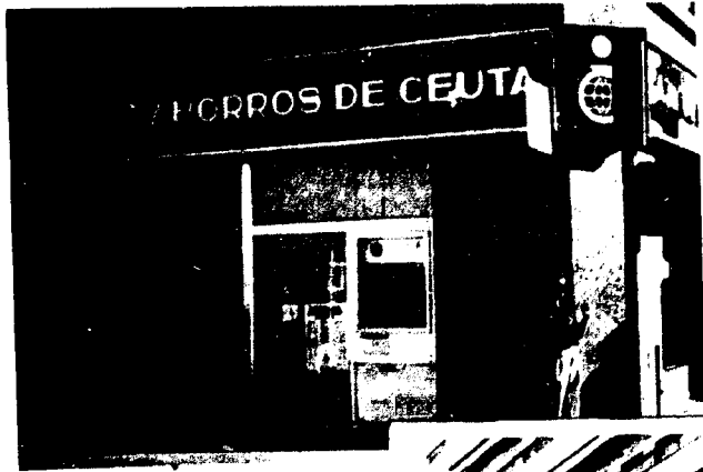
URBANA NUM UNO Plaza de la Constitución (CAJERO AUTOMATICO)