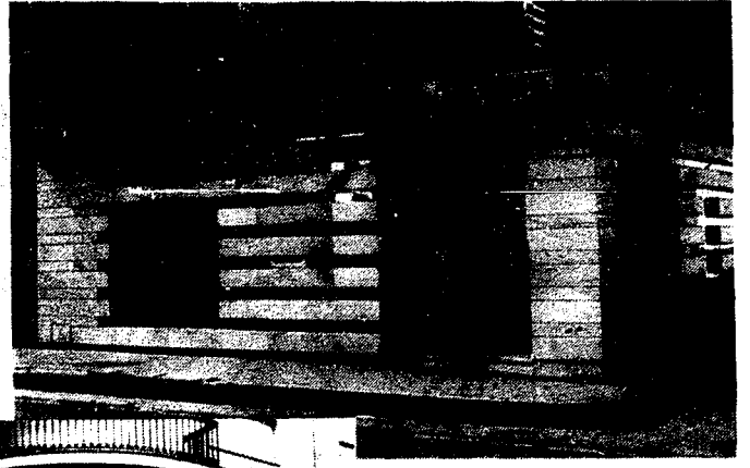
URBANA NUM. DOS Barriada de San José (CAJERO AUTOMATICO)