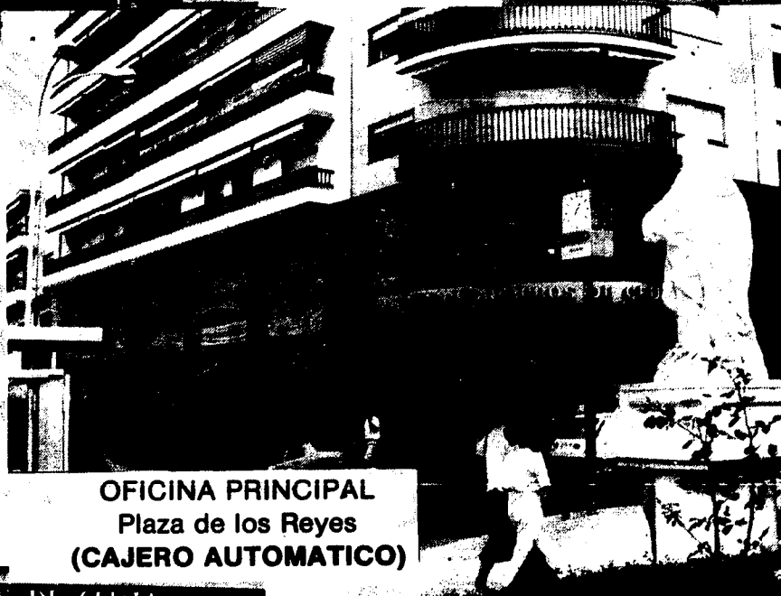
OFICINA PRINCIPAL Plaza de los Reyes (CAJERO AUTOMATICO)