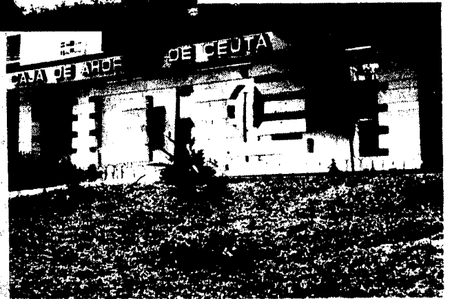
URBANA NUM. CUATRO Polígono Virgen de Africa