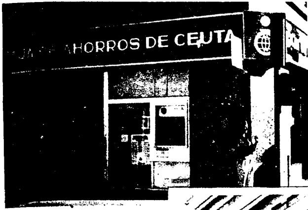
URBANA NUM UNO Plaza de la Constitucion (CAJERO AUTOMATICO)