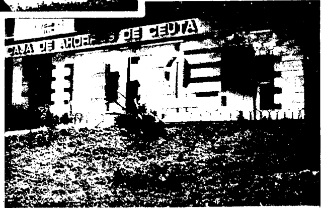
URBANA NUM CUATRO Poligono Virgen de Africa