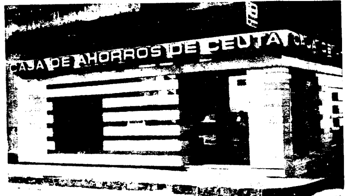
URBANA NUM DOS Barriada de San Jose (CAJERO AUTOMATICO)