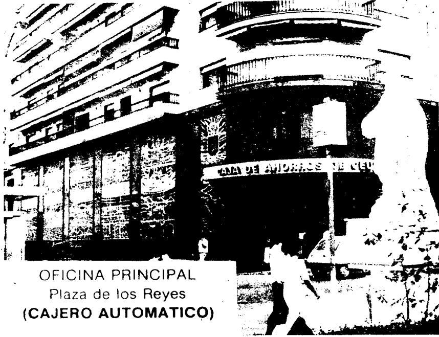
OFICINA PRINCIPAL Plaza de los Reyes (CAJERO AUTOMATICO)