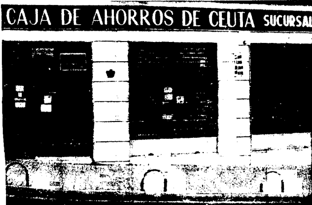
URBANA NUM TRES Barriada de Villa-Jovita