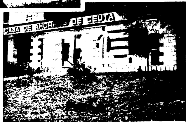
URBANA NUM CUATRO Poligono Virgen de Africa