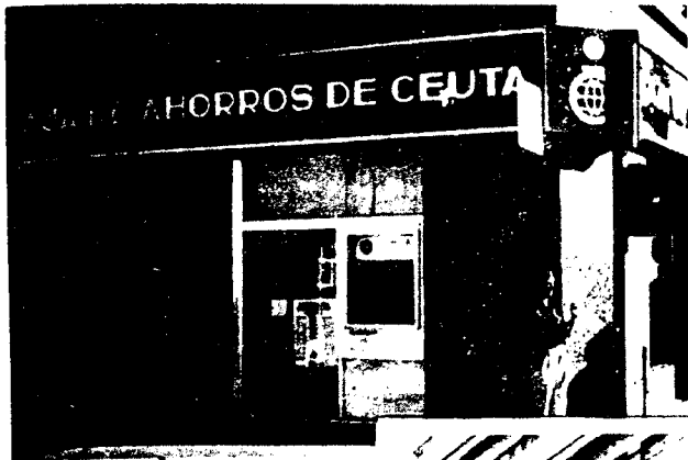
URBANA NUM UNO Plaza de la Constitución (CAJERO AUTOMATICO)