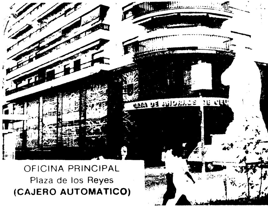
OFICINA PRINCIPAL Plaza de los Reyes (CAJERO AUTOMATICO)