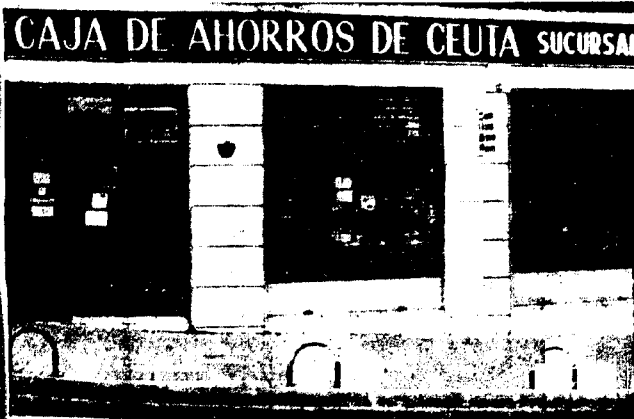
URBANA NUM TRES Barriada de Villa-Jovita