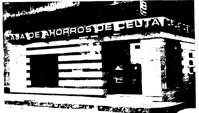
URBANA NUM DOS Barriada de San Jose (CAJERO AUTOMATICO)