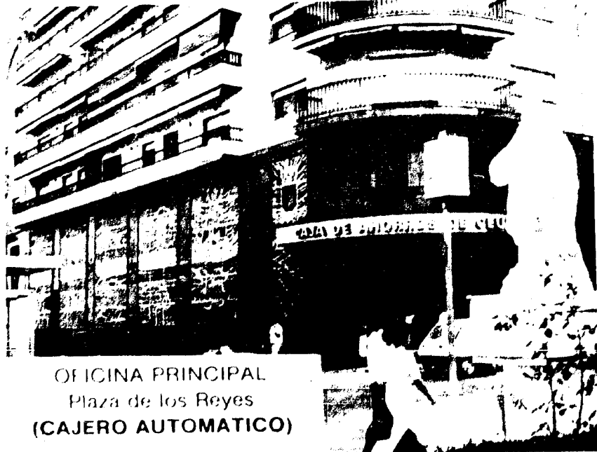
OFICINA PRINCIPAL Plaza de los Reyes (CAJERO AUTOMATICO)