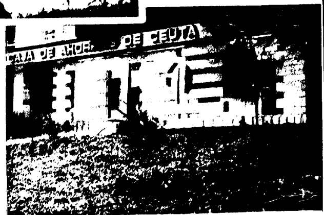
URBANA NUM CUATRO Poligono Virgen de Africa