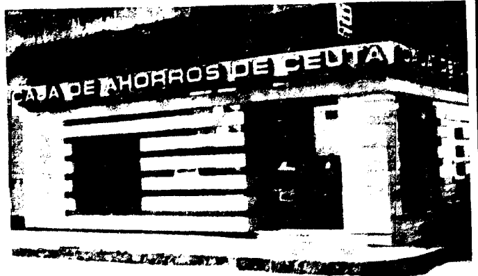
URBANA NUM DOS Barrada de San Jose (CAJERO AUTOMATICO)