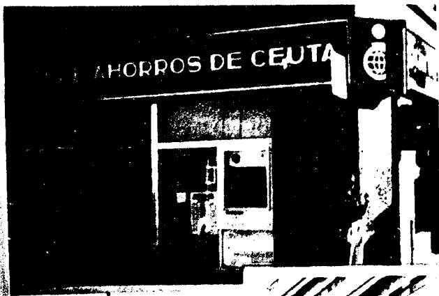
URBANA NUM UNO Plaza de la Constitución (CAJERO AUTOMATICO)