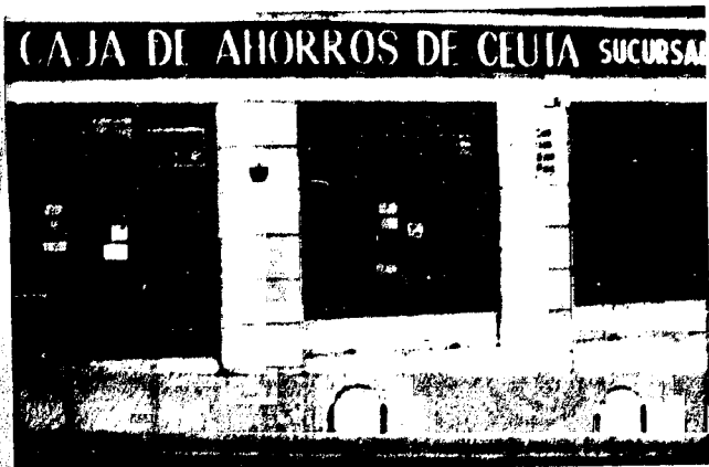
URBANA NUM TRES Barrada de Villa-Jovita