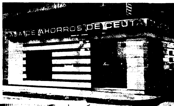
URBANA NUM. DOS Barriada de San José (CAJERO AUTOMATICO)