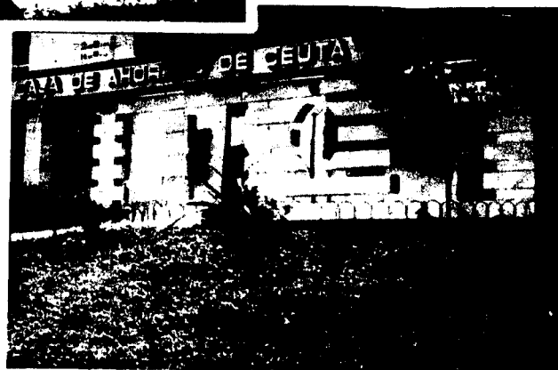
URBANA NUM CUATRO Polígono Virgen de África