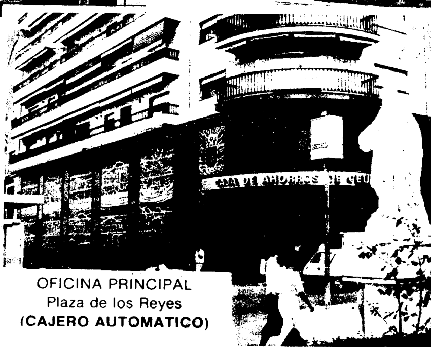
OFICINA PRINCIPAL Plaza de los Reyes (CAJERO AUTOMATICO)