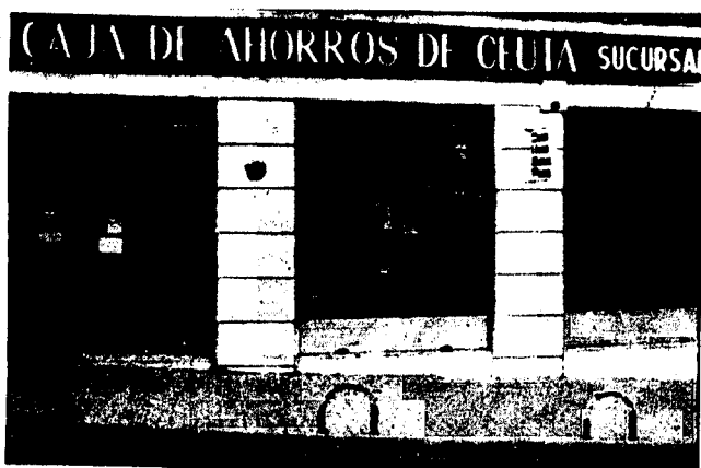
URBANA NUM TRES Barriada de Villa-Jovita