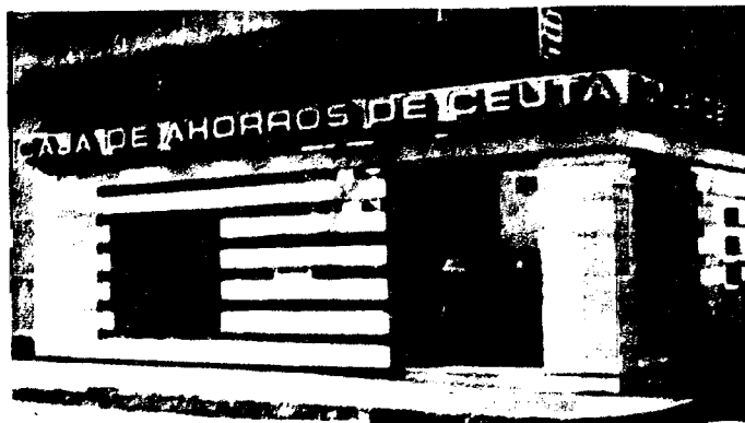
URBANA NUM DOS Barrada de San José (CAJERO AUTOMATICO)