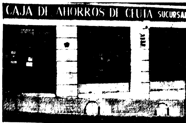
URBANA NUM TRES Barrada de Zola Jozita