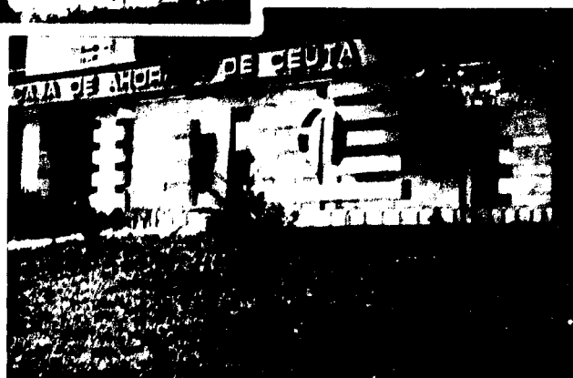
URBANA NUM CUATRO Polígono Virgen de África