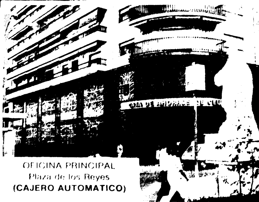
OFICINA PRINCIPAL Plaza de los Reyes (CAJERO AUTOMATICO)