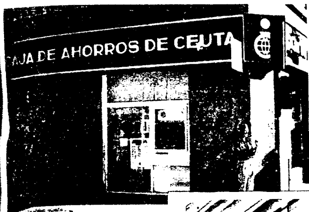
URBANA NUM UNO Plaza de la Constitucion (CAJERO AUTOMATICO)