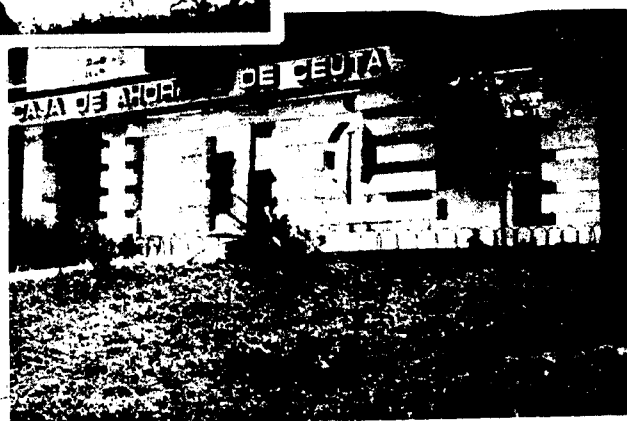
URBANA NUM CUATRO Poligono Virgen de Africa