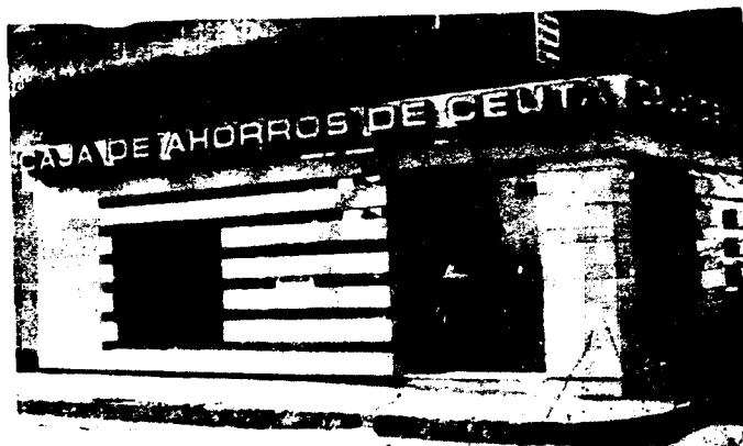
URBANA NUM. DOS Barriada de San José (CAJERO AUTOMATICO)