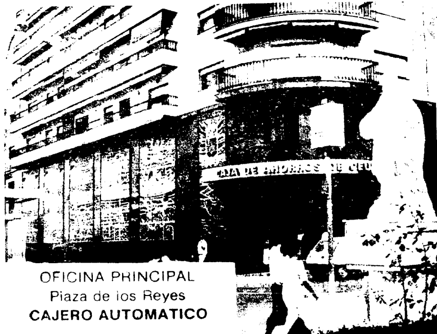
OFICINA PRINCIPAL Plaza de los Reyes CAJERO AUTOMATICO