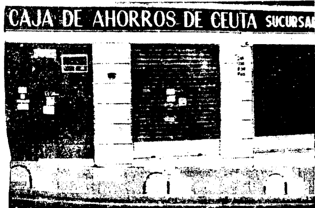
URBANA NUM TRES Barriada de Villa-Jovita