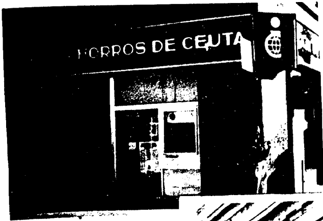
URBANA NUM UNO Plaza de la Constitución (CAJERO AUTOMATICO)