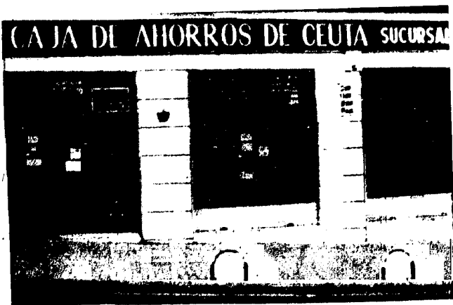
URBANA NUM TRES Barriada de Villa Jovita