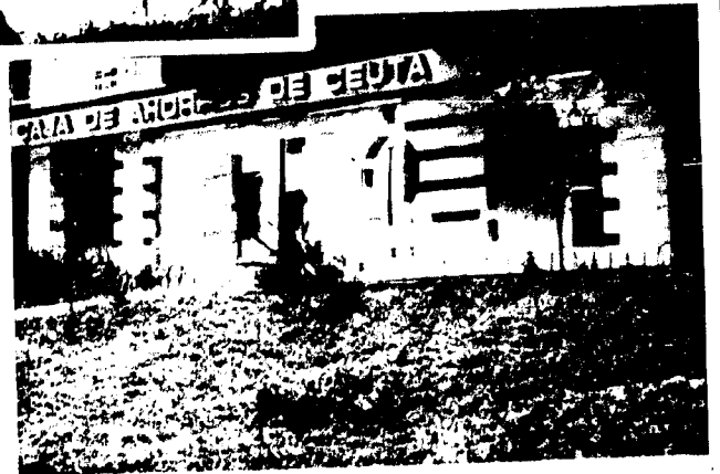
URBANA NUM CUATRO Polígono Virgen de África