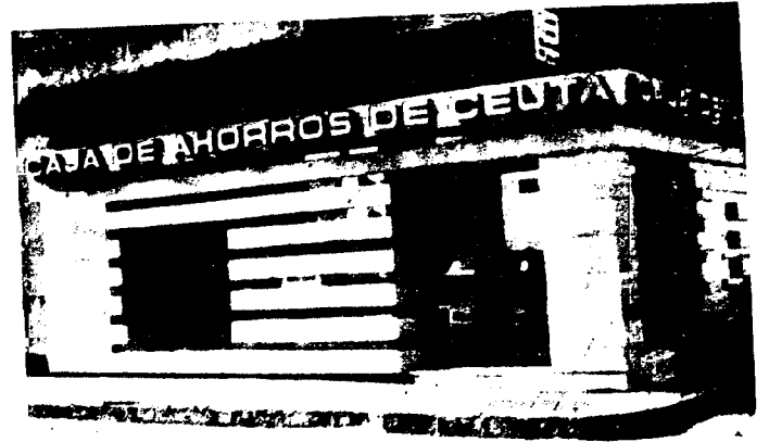
URBANA NUM DOS Barriada de San José (CAJERO AUTOMATICO)