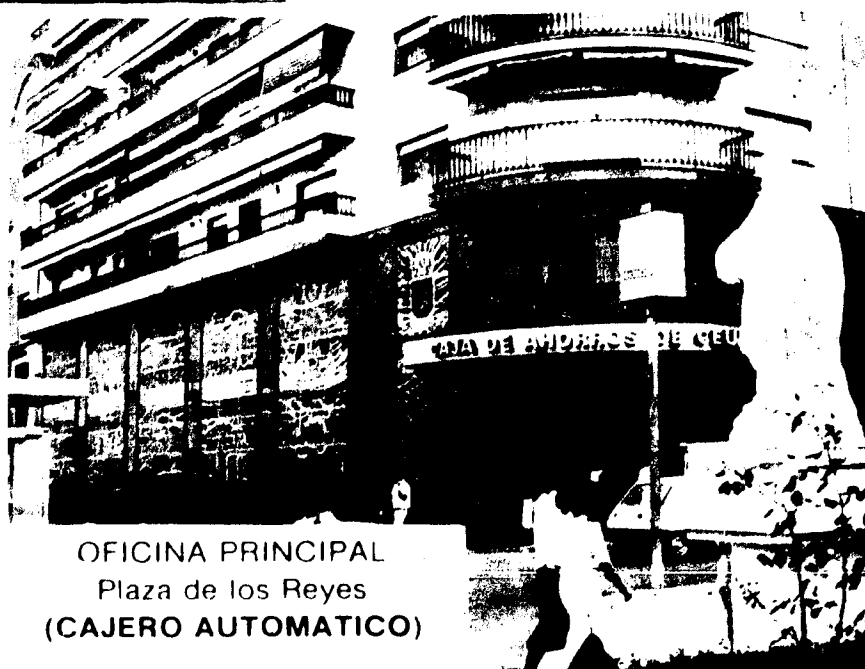
OFICINA PRINCIPAL Plaza de los Reyes (CAJERO AUTOMATICO)