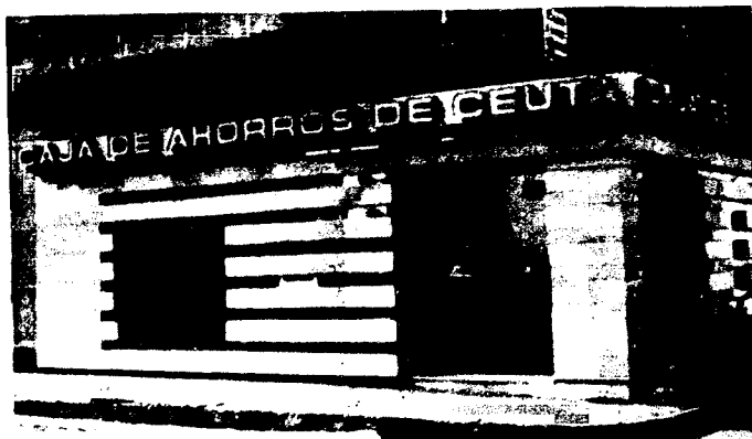
URBANA NUM. DOS Barriada de San José (CAJERO AUTOMATICO)