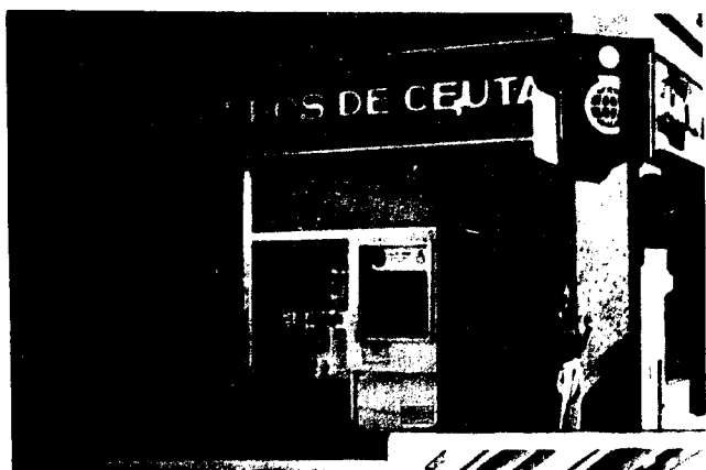
URBANA NUM UNO Plaza de la Constitucion (CAJERO AUTOMATICO)