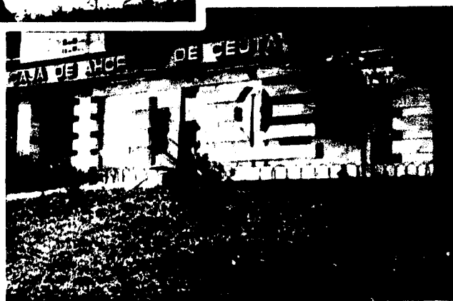
URBANA NUM CUATRO Poligono Virgen de Africa