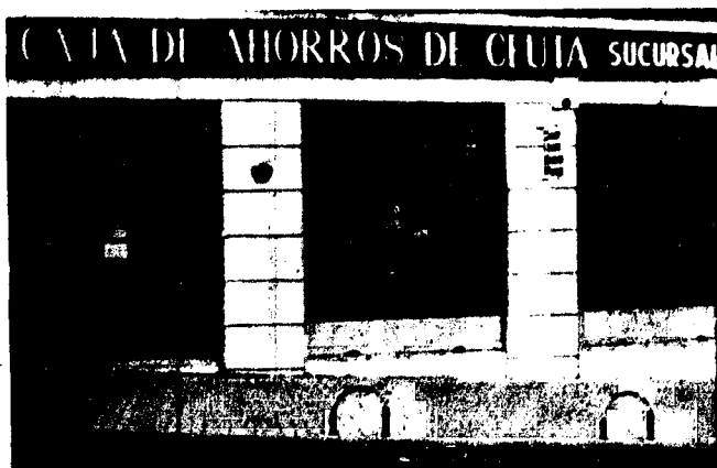
URBANA NUM TRES Barriada de Villa-Jovita