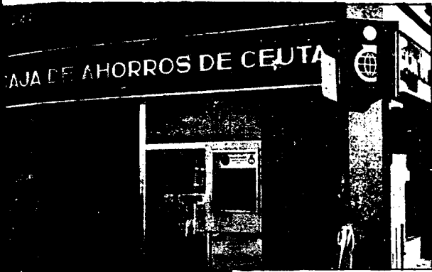
URBANA NUM. UNO Plaza de la Constitución (CAJERO AUTOMATICO)