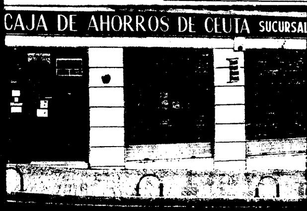
URBANA NUM. TRES Barriada de Villa-Jovita