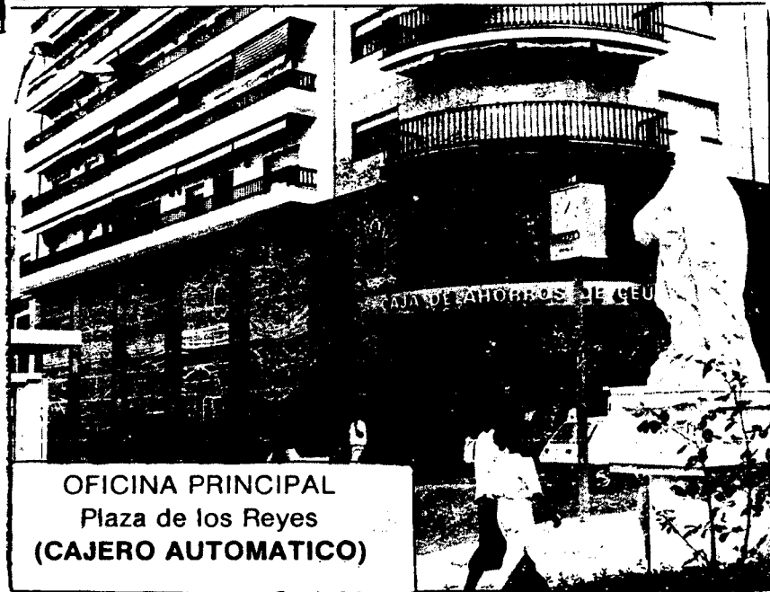
OFICINA PRINCIPAL Plaza de los Reyes (CAJERO AUTOMATICO)