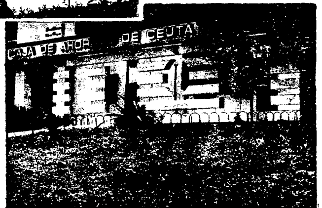
URBANA NUM. CUATRO Poligono Virgen de Africa