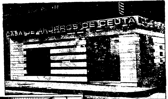
URBANA NUM. DOS Barriada de San José (CAJERO AUTOMATICO)