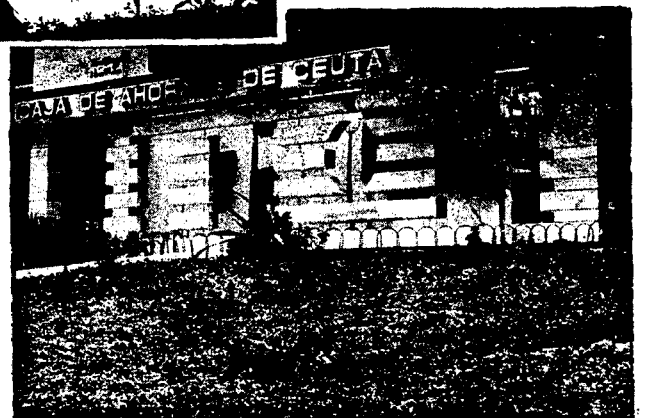
URBANA NUM. CUATRO Poligono Virgen de Africa