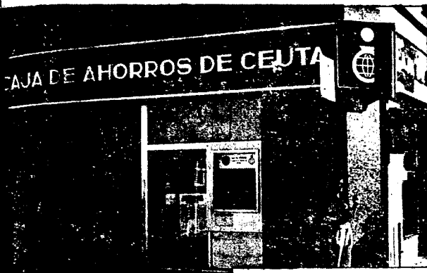
URBANA NUM. UNO Plaza de la Constitucion CAJERO AUTOMATICO