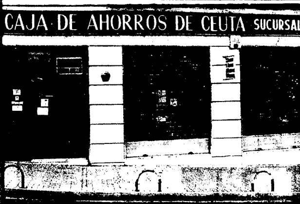
URBANA NUM. TRES Barriada de Villa-Jovita