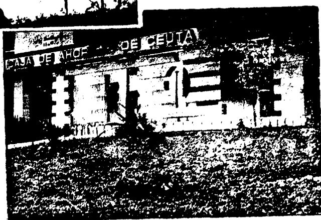
URBANA NUM. CUATRO Poligono Virgen de Africa