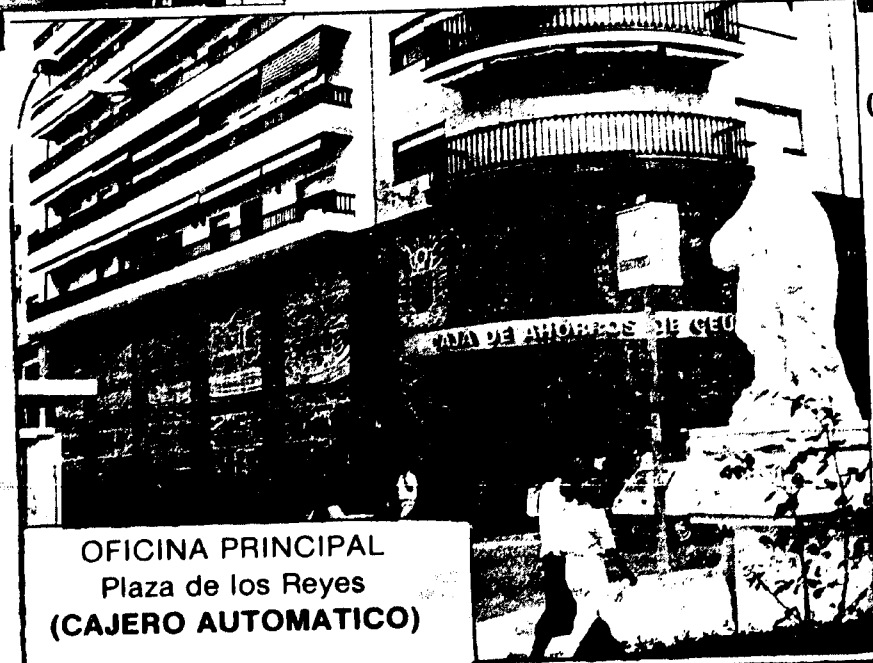
OFICINA PRINCIPAL Plaza de los Reyes (CAJERO AUTOMATICO)