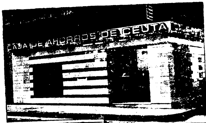
URBANA NUM. DOS Barriada de San José (CAJERO AUTOMATICO)