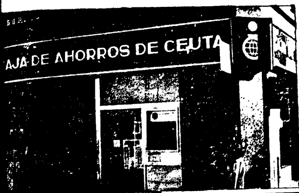
URBANA NUM. UNO Plaza de la Constitucion (CAJERO AUTOMATICO)