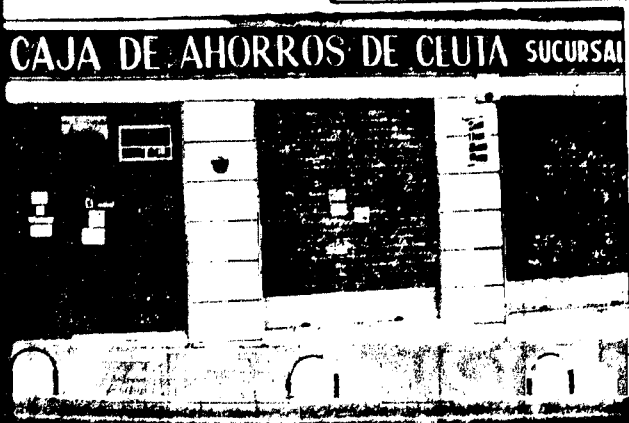
URBANA NUM. TRES Barriada de Villa-Jovita