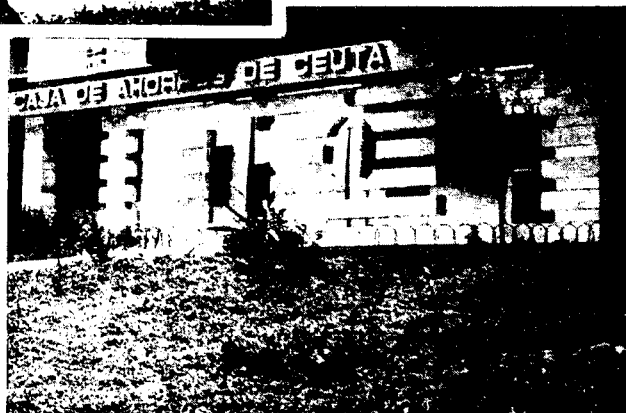
URBANA NUM CUATRO Poligono Virgen de Africa