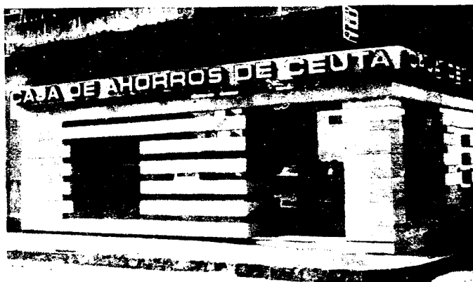
URBANA NUM DOS Barriada de San Jose (CAJERO AUTOMATICO)