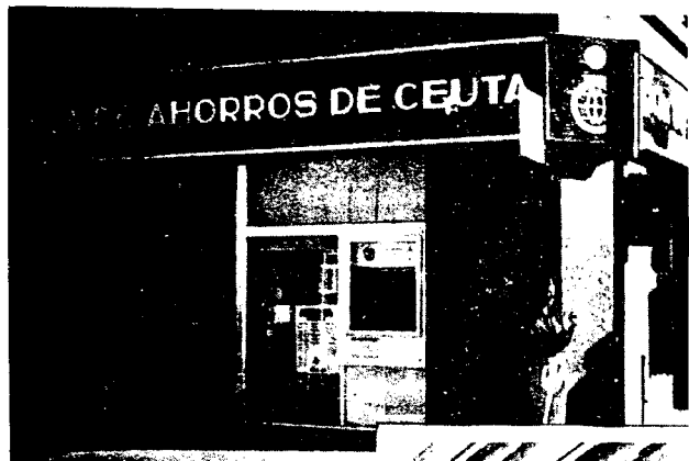
URBANA NUM UNO Plaza de la Constitucion (CAJERO AUTOMATICO)