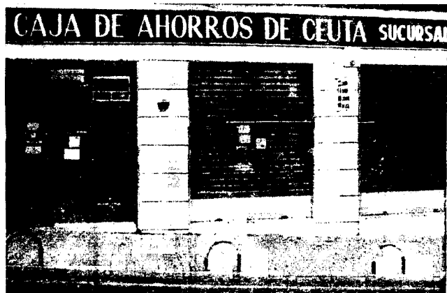
URBANA NUM TRES Barriada de Villa Jovita