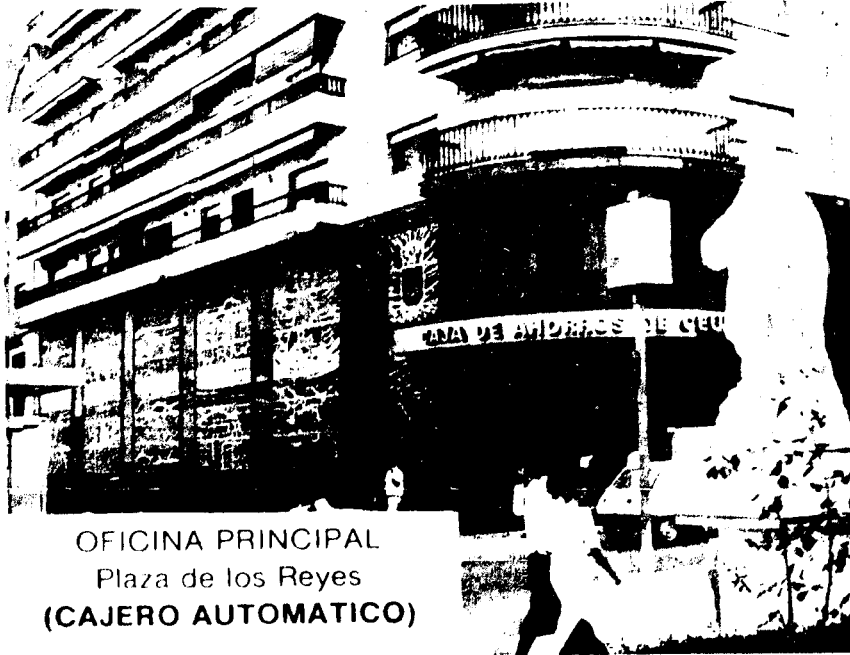
OFICINA PRINCIPAL Plaza de los Reyes (CAJERO AUTOMÁTICO)