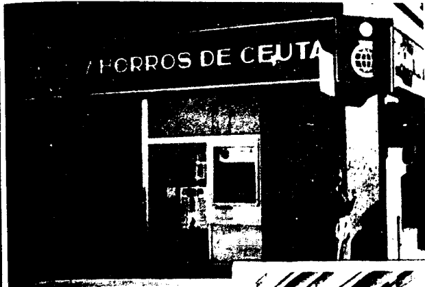
URBANA NUM UNO Plaza de la Constitución (CAJERO AUTOMÁTICO)