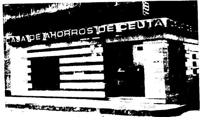
URBANA NUM DOS Barrada de San José (CAJERO AUTOMÁTICO)