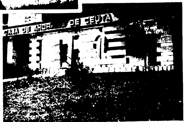
URBANA NUM CUATRO Polígono Virgen de África