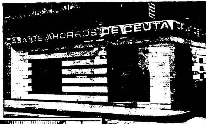
URBANA NUM. DOS Barriada de San José (CAJERO AUTOMATICO)