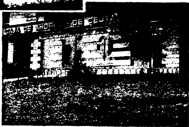
URBANA NUM. CUATRO Poligono Virgen de Africa