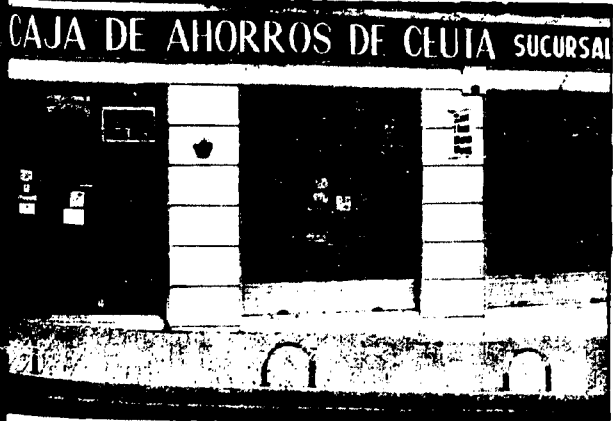
URBANA NUM. TRES Barriada de Villa-Jovita