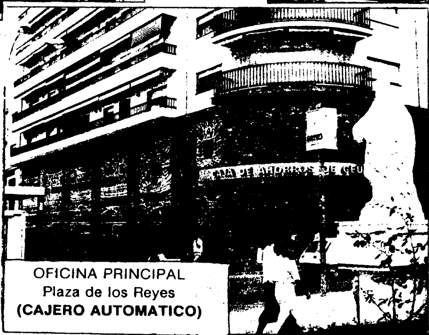
OFICINA PRINCIPAL Plaza de los Reyes (CAJERO AUTOMATICO)