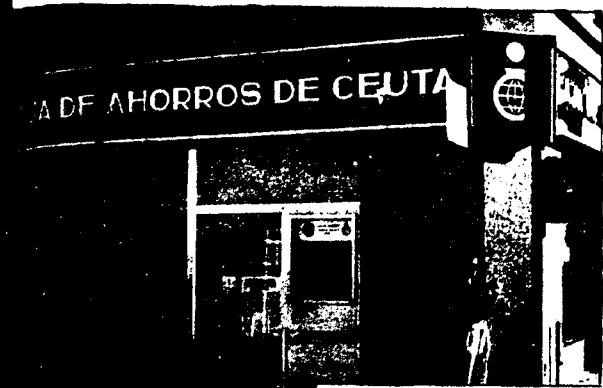
URBANA NUM. UNO Plaza de la Constitucion (CAJERO AUTOMATICO)