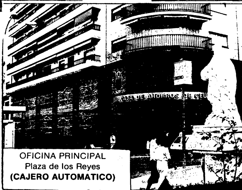
OFICINA PRINCIPAL Plaza de los Reyes (CAJERO AUTOMATICO)