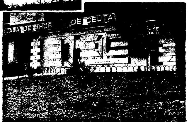
URBANA NUM. CUATRO Poligono Virgen de Africa