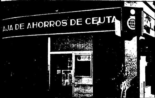
URBANA NUM. UNO Plaza de la Constitucion (CAJERO AUTOMATICO)