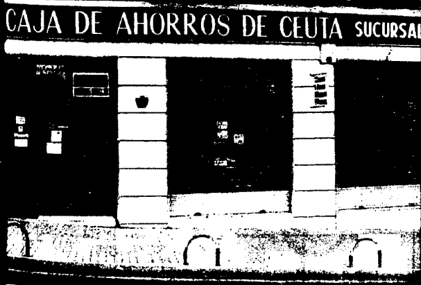
URBANA NUM. TRES Barriada de Villa-Jovita