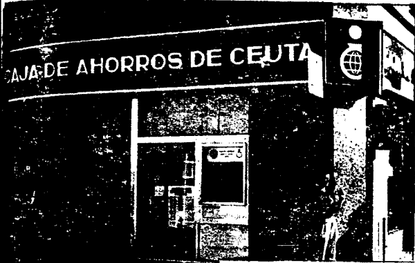
URBANA NUM. UNO Plaza de la Constitución (CAJERO AUTOMATICO)