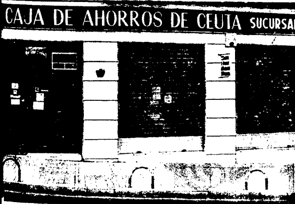
URBANA NUM. TRES Barriada de Villa-Jovita