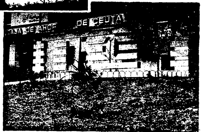
URBANA NUM. CUATRO Poligono Virgen de Africa