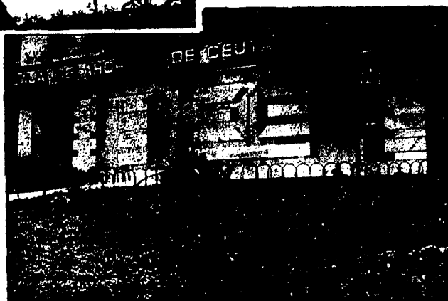
URBANA NUM. CUATRO Poligono Virgen de Africa