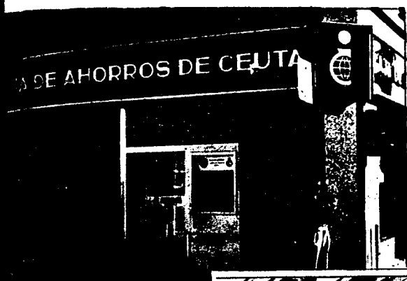
URBANA NUM. UNO Plaza de la Constitucion (CAJERO AUTOMATICO)