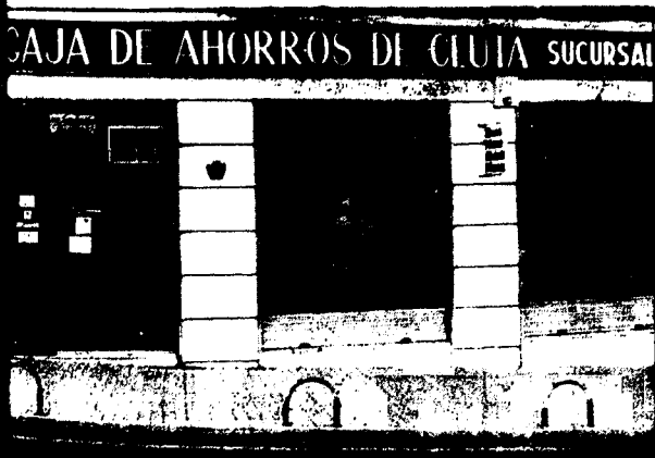
URBANA NUM. TRES Barriada de Villa-Jovita