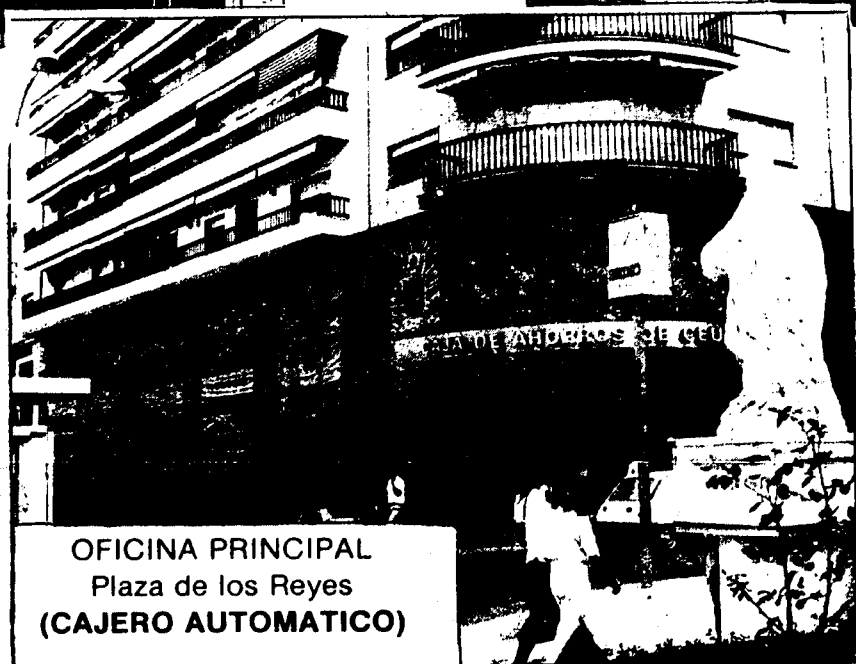
OFICINA PRINCIPAL Plaza de los Reyes (CAJERO AUTOMATICO)