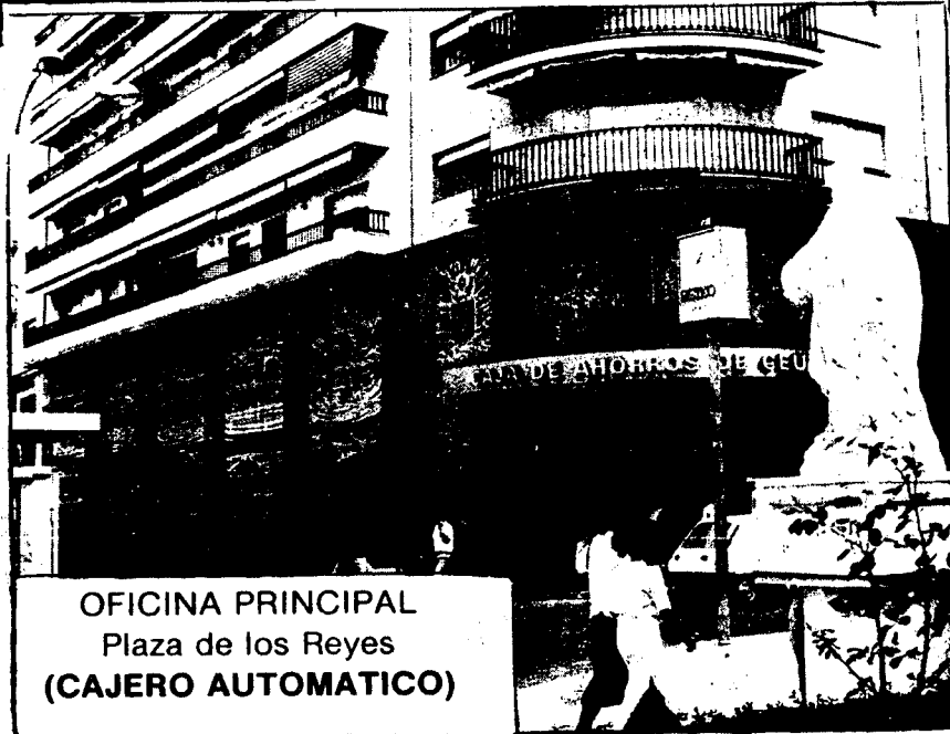
OFICINA PRINCIPAL Plaza de los Reyes (CAJERO AUTOMATICO)