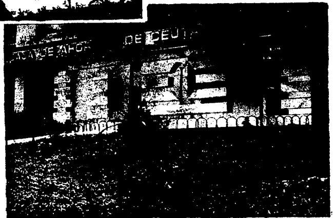
URBANA NUM. CUATRO Poligono Virgen de Africa