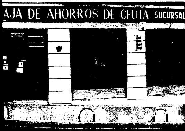
URBANA NUM. TRES Barriada de Villa-Jovita