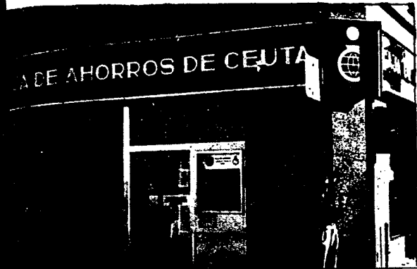
URBANA NUM. UNO Plaza de la Constitucion (CAJERO AUTOMATICO)