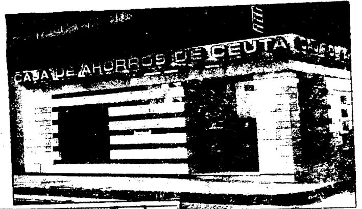
URBANA NUM. DOS Barriada de San José (CAJERO AUTOMATICO)