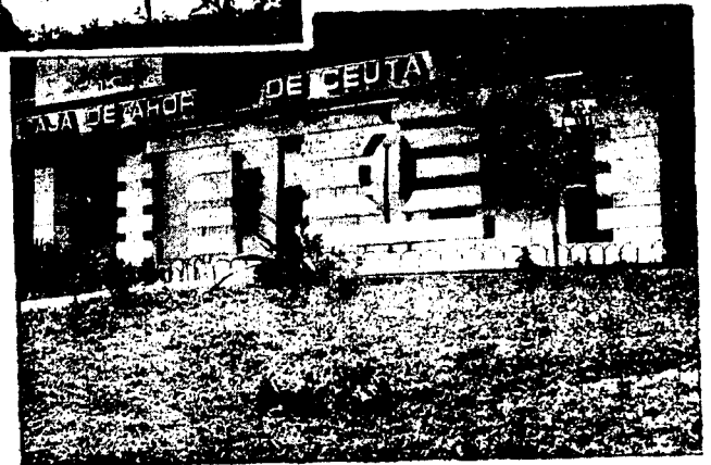
URBANA NUM. CUATRO Poligono Virgen de Africa