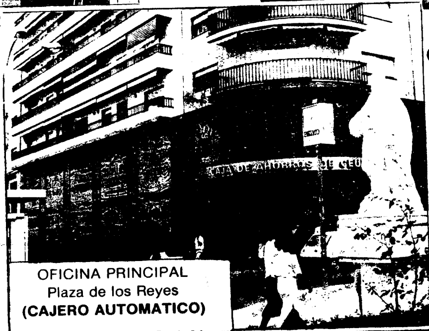
OFICINA PRINCIPAL Plaza de los Reyes (CAJERO AUTOMATICO)