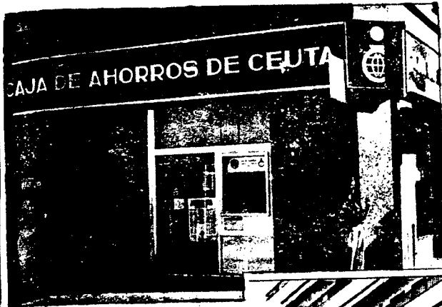
URBANA NUM. UNO Plaza de la Constitucion (CAJERO AUTOMATICO)