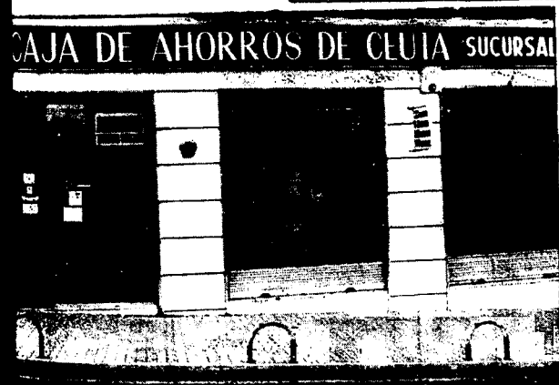
URBANA NUM. TRES Barriada de Villa-Jovita