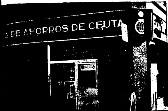
URBANA NUM. UNO Plaza de la Constitucion (CAJERO AUTOMATICO)