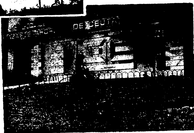
URBANA NUM. CUATRO Poligono Virgen de Africa