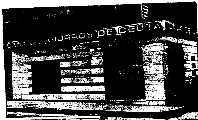
URBANA NUM. DOS Barriada de San José (CAJERO AUTOMATICO)