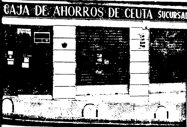
URBANA NUM. TRES Barriada de Villa-Jovita