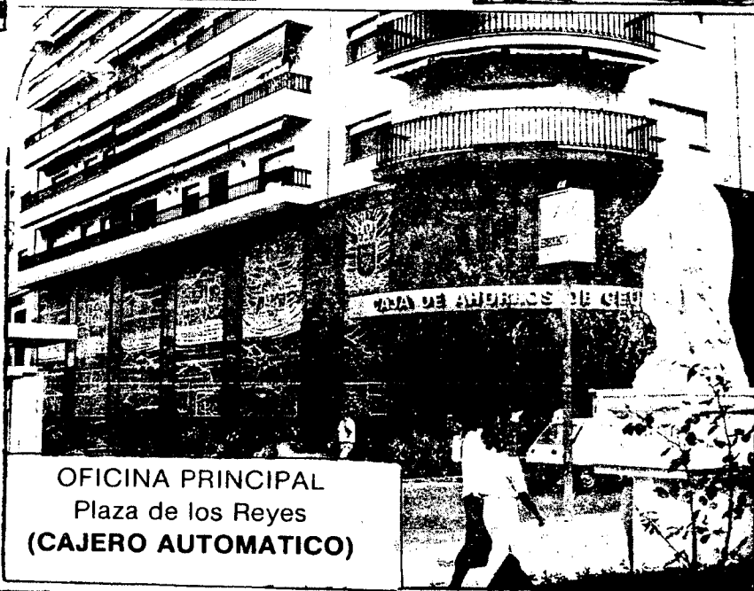
OFICINA PRINCIPAL Plaza de los Reyes (CAJERO AUTOMÁTICO)