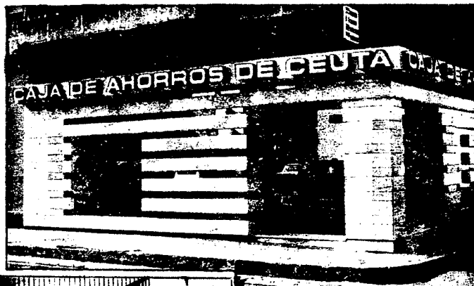
URBANA NUM. DOS Barriada de San José (CAJERO AUTOMÁTICO)