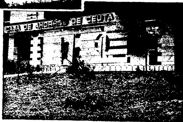
URBANA NUM. CUATRO Polígono Virgen de África