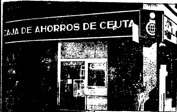
URBANA NUM. UNO Plaza de la Constitución (CAJERO AUTOMÁTICO)